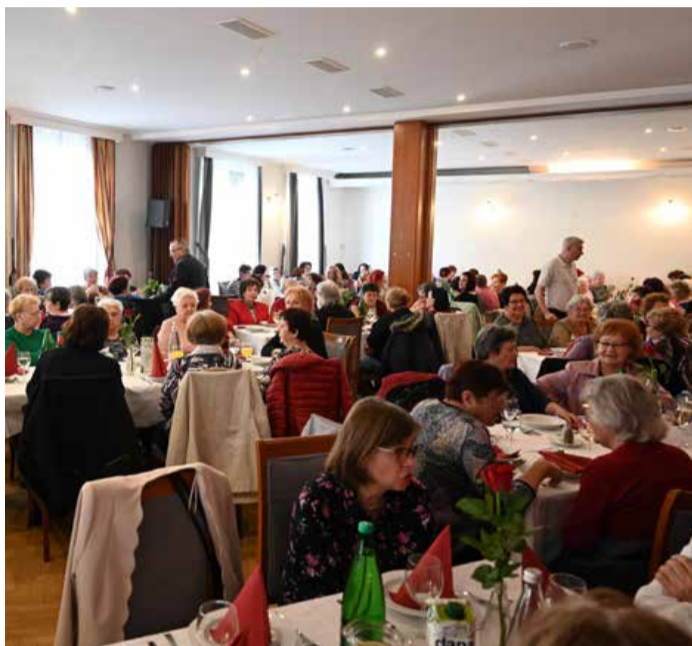
Mestna občina in mestne četrti so z dogodkom, polnim toplote, ženskam izkazale spoštovanje in priznanje.

Mestne četrti Murske Sobote so ob dnevu žena pripravile prireditev, s katero so počastile vse ženske in njihov pomemben prispevek k družbi.