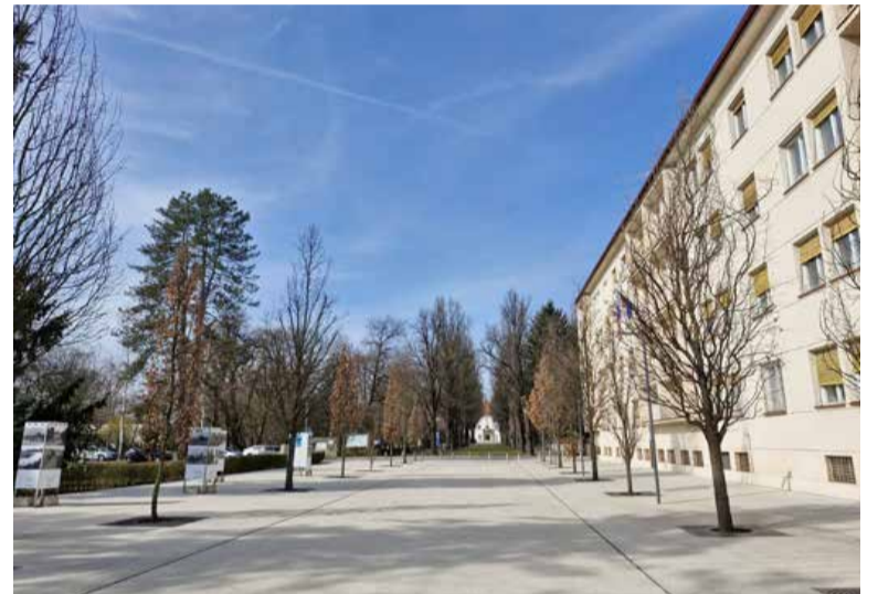
Murska Sobota se uvršča v vrh na področju trga dela in izobrazbe, kjer se glede na sestavljene indekse uvršča v zgornjo deseterico krajev.