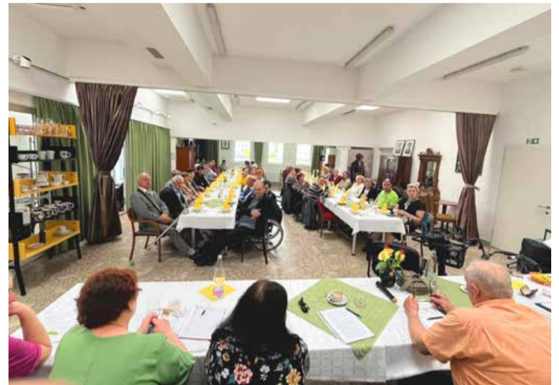
Županovo priznanje jim pomeni veliko, saj dokazuje, da so zelo aktivni in da je njihovo delo opaženo. Priznanje jim prinaša tudi nove priložnosti pri izvajanju programov.

Osebam z multiplo sklerozo pomagajo tako z zdravstvenega kot tudi psihosocialnega vidika, in sicer s posebnimi socialnimi programi, prilagojenimi specifičnim kategorijam članstva. Ti programi osebam z multiplo sklerozo omogočajo, da lahko čim dlje ostanejo samostojne in neodvisne, kakovost njihovega življenja pa ostane na najvišji ravni.