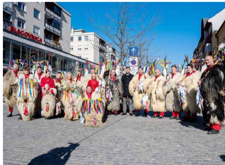
Mursko Soboto so (tradicionalno) obiskali kurenti.