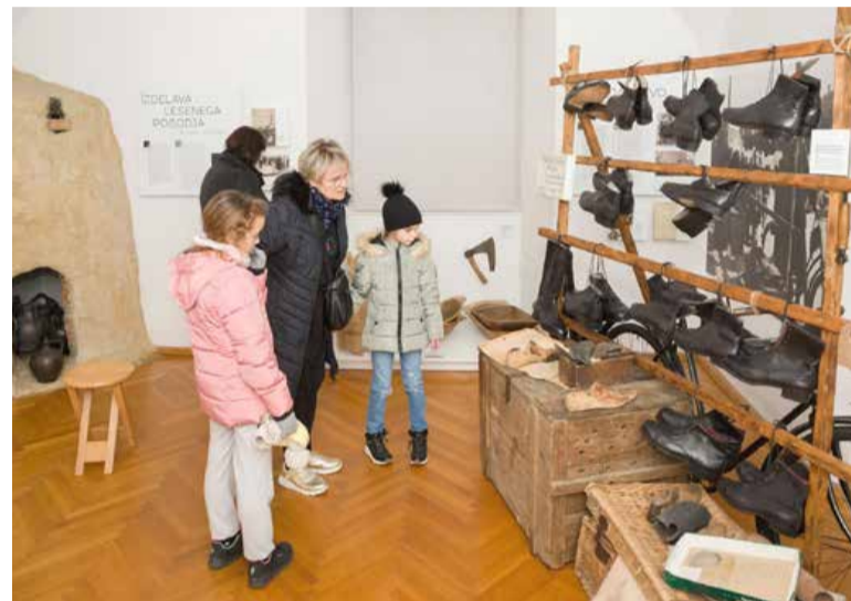
Stalna razstava v muzeju vedno pritegne.