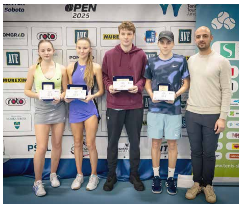
Tenis center Murska Sobota vabi vse ljubitelje športa, da si ogledajo tekme ženskega profesionalnega turnirja (od 23. do 30. marca 2025).

dva mednarodna turnirja: BTC – Murska Sobota Open 2025 in ITF J30 – Murska Sobota Summer Open 2025. Prvi bo njihov največji dogodek v letošnjem letu in bo potekal od 23. do 30. marca 2025. Ta ženski profesionalni teniški turnir šteje za svetovno lestvico WTA, organizatorji pa so ga letos še nadgradili. Z nagradnim skladom 60.000 ameriških dolarjev bo drugi največji teniški turnir v Sloveniji. V septembru bo sledil mednarodni mladinski turnir za svetovno lestvico, med letom pa bo potekalo še 25 drugih tekmovanj na nacionalni in klubski ravni, vključno z državnim prvenstvom za šestnajstletnike.