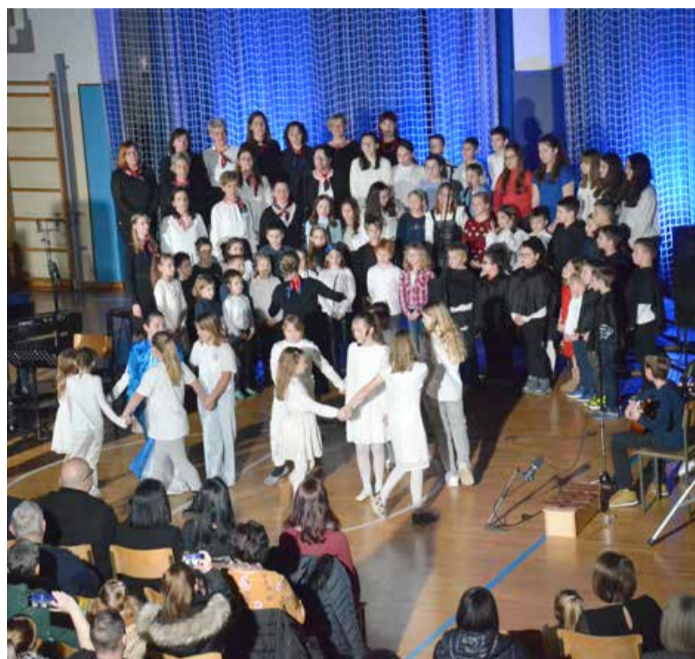
Poklonili so se največjemu slovenskemu pesniku Francetu Prešernu.

Osnovna šola Bakovci je pripravila slovesno proslavo ob slovenskem kulturnem prazniku. Z njo so se poklonili umetnosti in njenim ustvarjalcem.