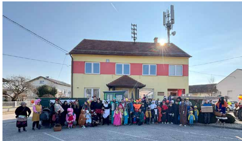
Več kot šestdeset krajanov je sončno nedeljo izkoristilo za pustno povorko po Krogu. Zbirali so prostovoljne prispevke za ljubiteljsko gledališko društvo Kroške tikvi, ki ponovno obuja delovanje, in zbrali 3267,83 evra.