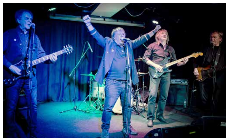
Pankrti so v okviru praznovanja 45. obletnice izida prvega albuma »Dolgcajt« obiskali Mikk.