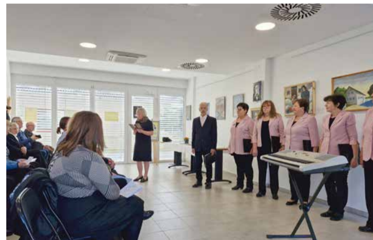
Upokojenci tudi letos s posebno prireditvijo.