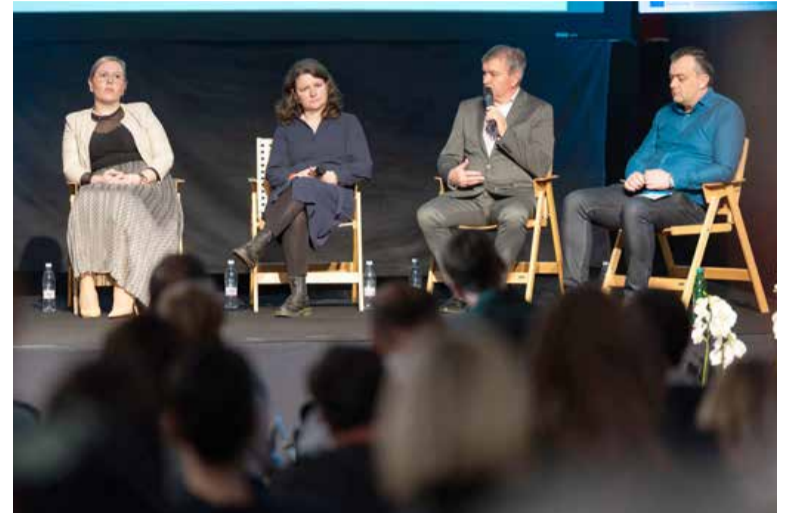
Strokovna konferenca Zdravje v naših rokah – Kmetijstvo za prihodnje generacije je združila strokovnjake, kmetovalce in predstavnike politike.

Na področju kmetijske zakonodaje se obeta veliko sprememb. Od namere, da naj bi javna služba kmetijskega svetovanja izpod okrilja Kmetijsko-gozdarske zbornice Slovenije prešla pod plašč kmetijskega ministrstva, je kmetijsko ministrstvo odstopilo, tačas pa je v javni obravnavi kar sedem zakonov: predlogi treh novih zakonov – o hrani, o varni hrani in krmi ter o zdravju živali; ter tri spremembe zakonov – o kmetijstvu, o kmetijskih zemljiščih in o gozdovih. V pripravi je še novela zakona o zaščiti živali. »Naši osnovni cilji so, da je kmet spoštovan, da dobro živi ter da prideluje zdravo in kakovostno hrano. Vsi si želimo urejene-