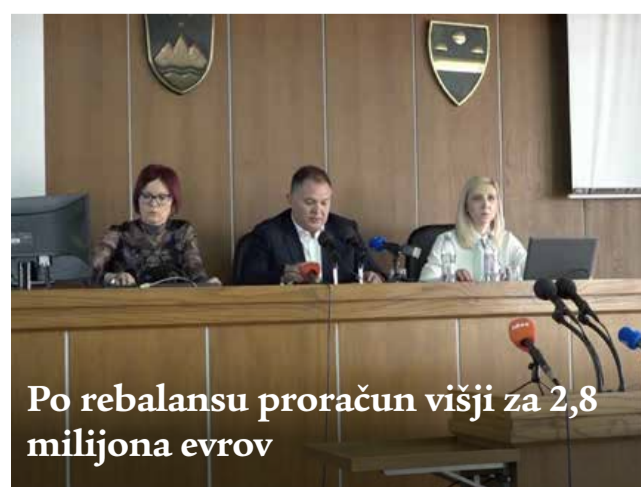
Po rebalansu proračun višji za 2,8 milijona evrov