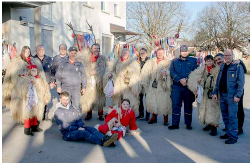
Pestro je bilo tudi v Černelavcih, za kar so tam prav tako poskrbeli kurenti.