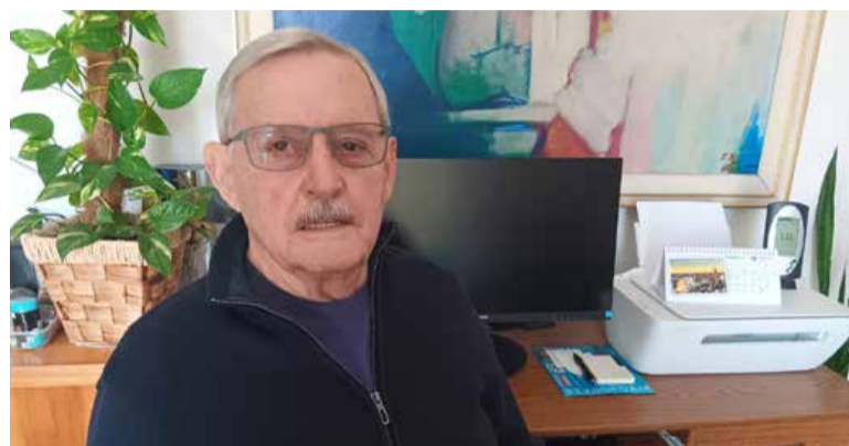
Njegov več kot 60-letni prispevek k športni dejavnosti v smislu organizacijskih, programskih in vsebinskih usmeritev je prežet z veliko požrtvovalnostjo in obilo prostovoljskega dela.

S pridobitvijo trenerja z licenco je v Murski Soboti ponovno zaživela športna gimnastika na najvišji ravni, kar je ostalo vse do lanske jeseni, zdaj pa nekateri drugi nadaljujejo njegovo delo. Za dobro organizirano športno rekreacijo vseh kategorij prebivalstva DŠR Murska Sobota je dobil certifikat Zdravo društvo.