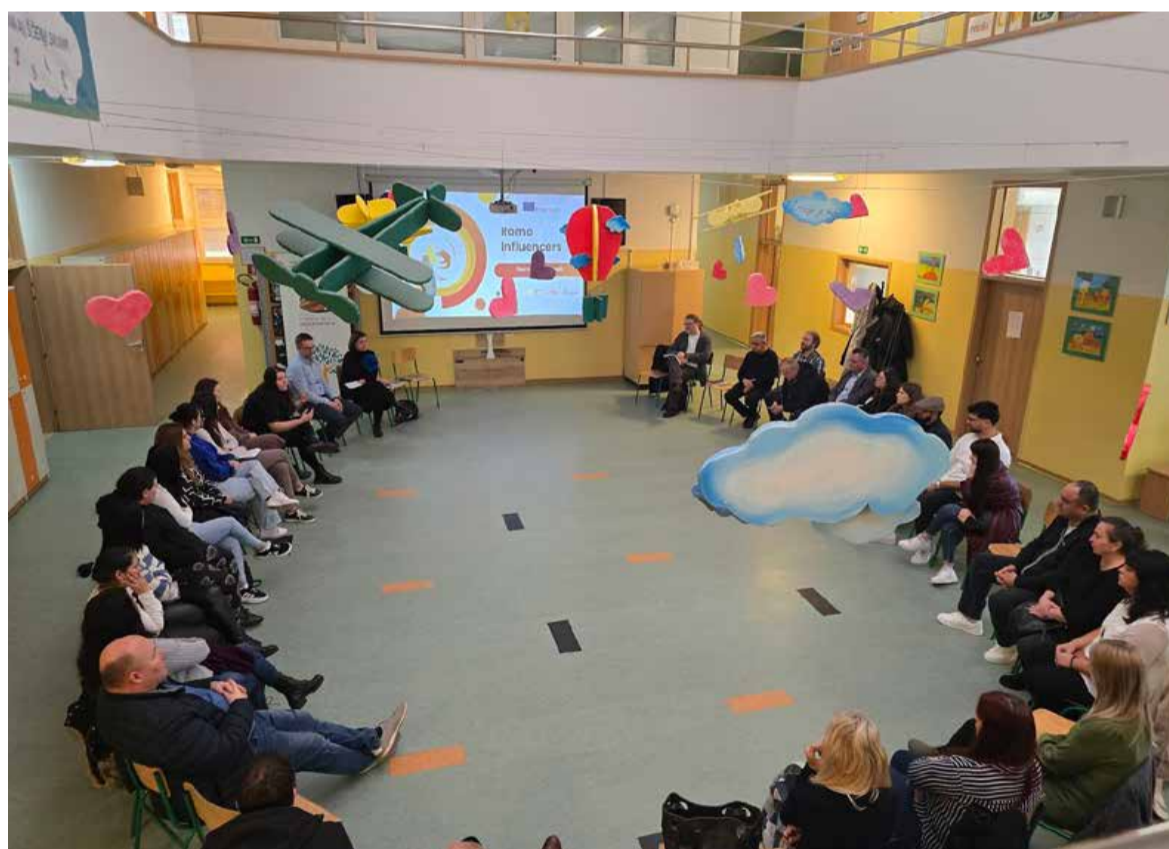
Projekt »Roma Influencers« je bil namenjen izpostavljanju navdihujočih zgodb uspešnih Romov in Rominj.

nega prostorskega načrta za Pomurje bodo v sodelovanju z ministrstvi organizirali javne razprave, posvete in druge dogodke o ključnih prostorskih tematikah. K sodelovanju bodo povabili predstavnike občin, institucij in podjetij ter splošno javnost, saj želijo