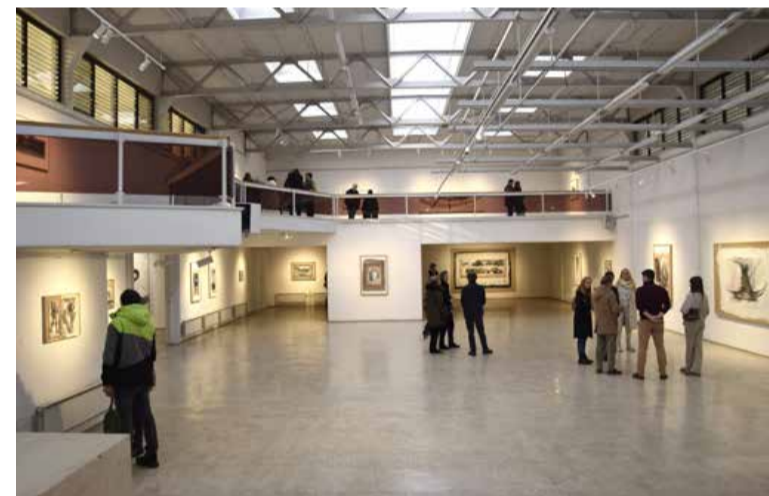
Tudi v galeriji je bilo zelo živahno.