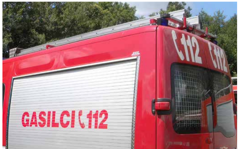
Številka 112 je zelo pogosto uporabljena.

26 zaradi požarov in eksplozij, 21 je bilo nesreč v prometu, 10 naravnih nesreč, 8 drugih nesreč, 4 onesnaženja oz. nesreče z nevarnimi snovmi, 9 pa je bilo nepotrebnih oziroma lažnih intervencij. Med gasilskimi društvi, ki so posredovala na območju občine, je le v enem primeru sodelovalo še društvo iz Ljutomera, sicer pa domača iz murskosoboške gasilske zveze. Skupno število aktiviranj je bilo 174, kar je za 13 več od vseh nesreč v občini. Vzrok tega razkoraka je v koncesiji PGD Murska Sobota za posredovanje na širšem območju,