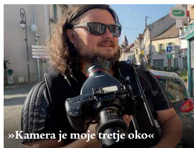
»Kamera je moje tretje oko«