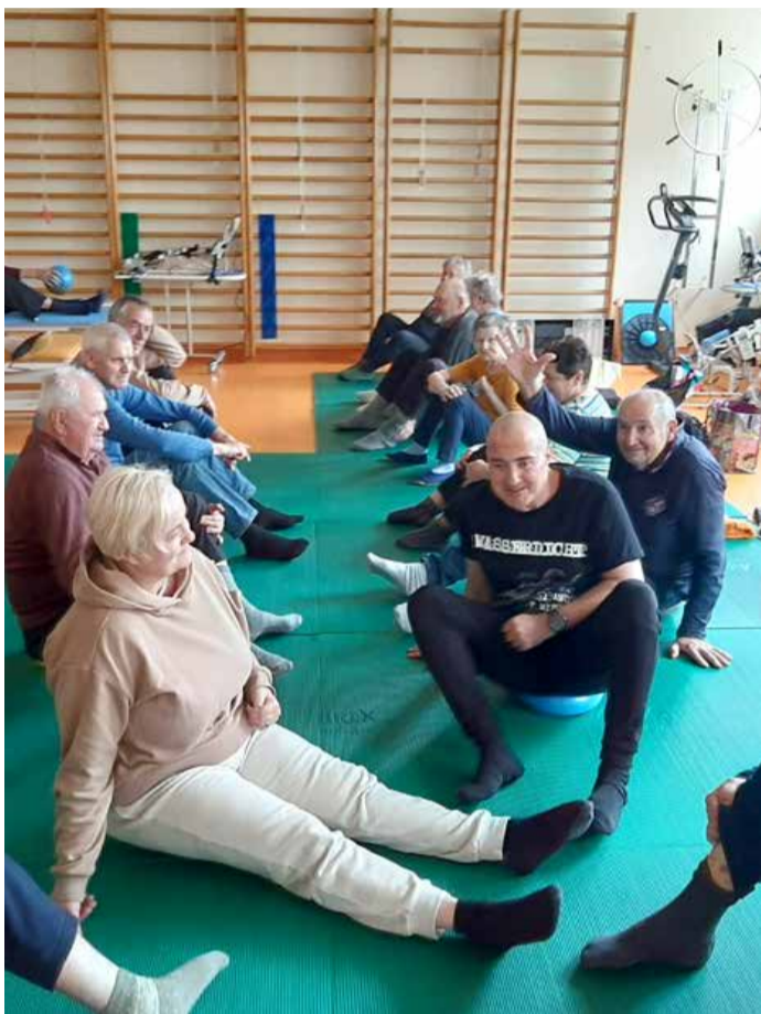
Redna telesna vadba je za člane zelo pomembna.

Največja želja so lastni prostori in širša družbena podpora.