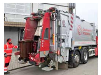
Ločevanje odpadkov je zelo pomembno. | Foto: Saubermacher-Komunala

leto 2022) največja občina, ki je vključena v zbiranje komunalnih odpadkov, je murskosoboška. Lansko leto je delež ločeno zbranih frakcij na njenem območju znašal že 62 %, kar pomeni 317 kg na prebivalca, vsak prebivalec v naši občini pa je ustvaril tudi 194 kg mešanih komunalnih odpadkov, kar je precej več od povprečja (pri mešanih odpadkih znaša 136 kg, pri ločenih zbranih frakcijah pa 204 kg).