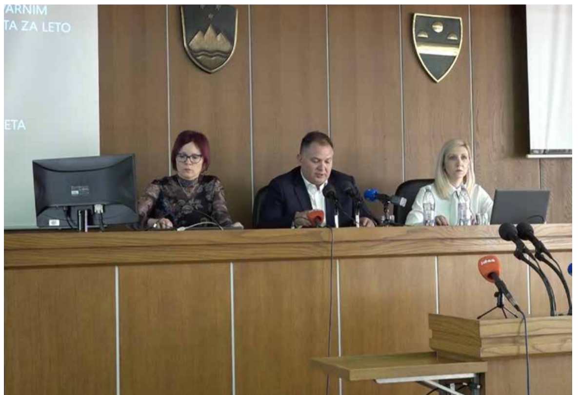
Po glasovanju so mestni svetniki rebalans po skrajšanem postopku potrdili. Točka o kadrovskih zadevah je bila v začetku seje umaknjena z dnevnega reda.