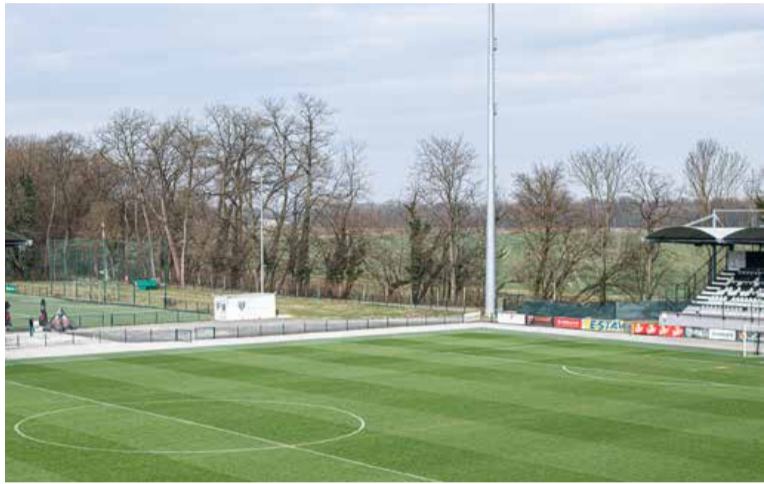
Severozahodni kotiček stadiona, kjer so nekoč igrali t. i. lepi špil, bo v kratkem pozidan z novo tribuno, ki bo sprejela do 1000 gledalcev.

Moramo poudariti, da je v tem trenutku predvidena samo prva faza gradnje, ki bo zajemala postavitev tribune s streho in spremljajočimi prostori, ki smo jih doslej omenili, torej s sanitarijami oziroma vsem, kar zahtevajo pravila za izdajo uporabnega dovoljenja za objekt za organizacijo in izvedbo nogometnih tekem. Garderobe oziroma slačilnice pod tribuno so predvidene v drugi fazi gradnje, kar pa se po trenutnih načrtih ne bo zgodilo prej kot v treh letih, razen če bi v klubu prej uspeli najti investitorja. »Po grobi oceni bi za