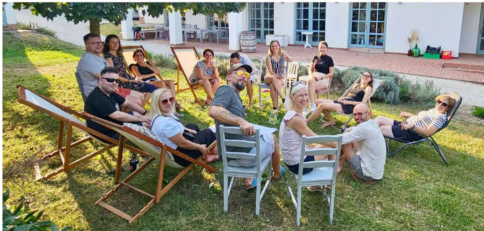
Razvojni center Murska Sobota kot povezovalni člen med občinami, podjetji, raziskovalnimi ustanovami in državnimi institucijami skrbi za strateški razvoj Pomurja. Kolektiv zaposlenih, ki delujejo na različnih razvojnih področjih, se letno srečuje na razvojnih srečanjih.

• V letu 2025 bodo organizirali več pomembnih dogodkov. V okviru priprave regional-