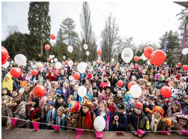
Otroški živžav na grajski ploščadi.

Dogodek je ponovno dokazal, da je pust v Murski Soboti priljubljena tradicija, ki povezuje skupnost ter prinaša veselje najmlajšim in njihovim staršem. Pustno dogajanje je tako v mesto prineslo obilico smeha, veselja in igrivosti.