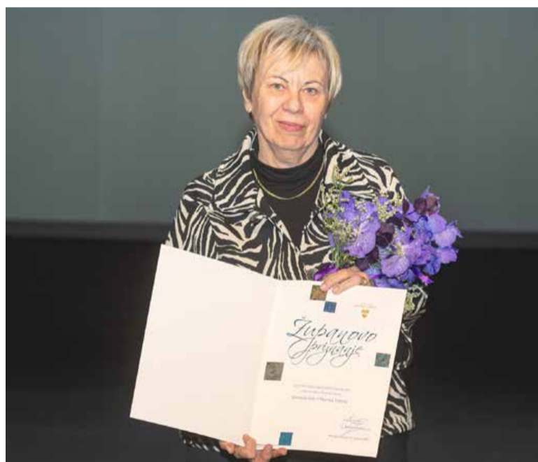
Osnovna šola II Murska Sobota je naj prostovoljska organizacija v letu 2024.