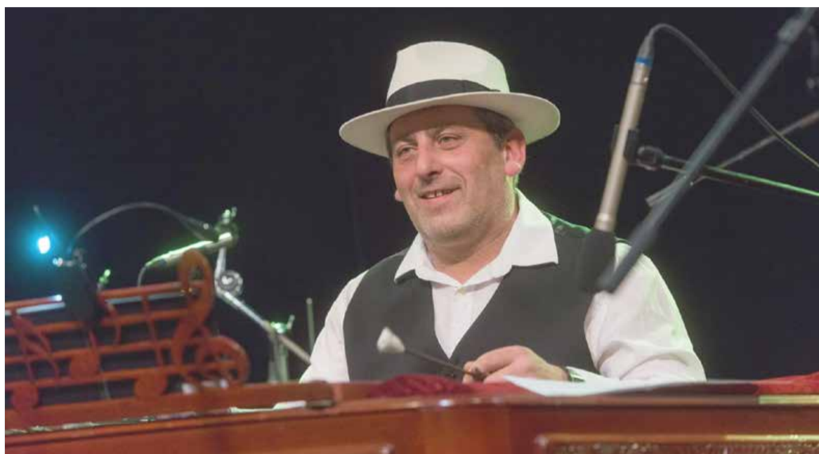
»Veseli sem, da se vse več učencev zanima za cimbele, saj bi brez njih izumrle.«