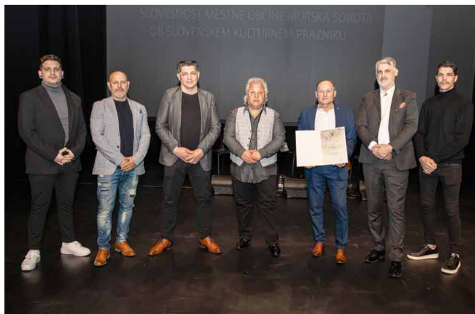
Priznanje mestne občine za uspešno delo in prispevek k razvoju kulturnih dejavnosti v občini je prejela romska glasbena skupina Romano Glauso.