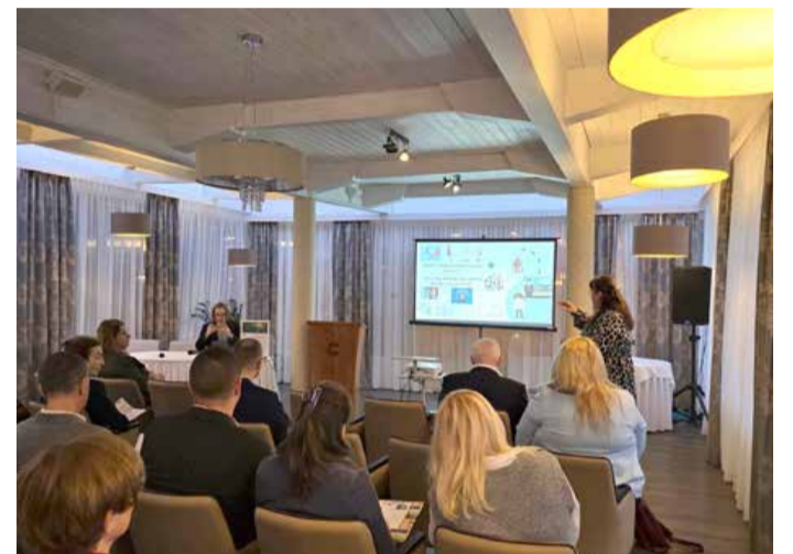
Partner projekta je tudi Razvojni center Murska Sobota.

Nedavno je v Hévízu potekalo prvo mednarodno strokovno srečanje projekta CROSSDEST – Razvoj čezmejne destinacije za vključujoč in trajnostni turizem na slovensko-madžarskem obmejnem območju, ki je del programa Interreg VI-A Slovenija-Madžarska 2021–2027.