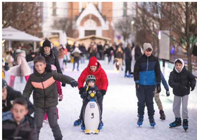
Drsališče je bilo tudi to zimo osrednja točka zimskega dogajanja v Pomurju.

Praznično dogajanje je popestril še praznični vrtiljak, ki je v nepo-