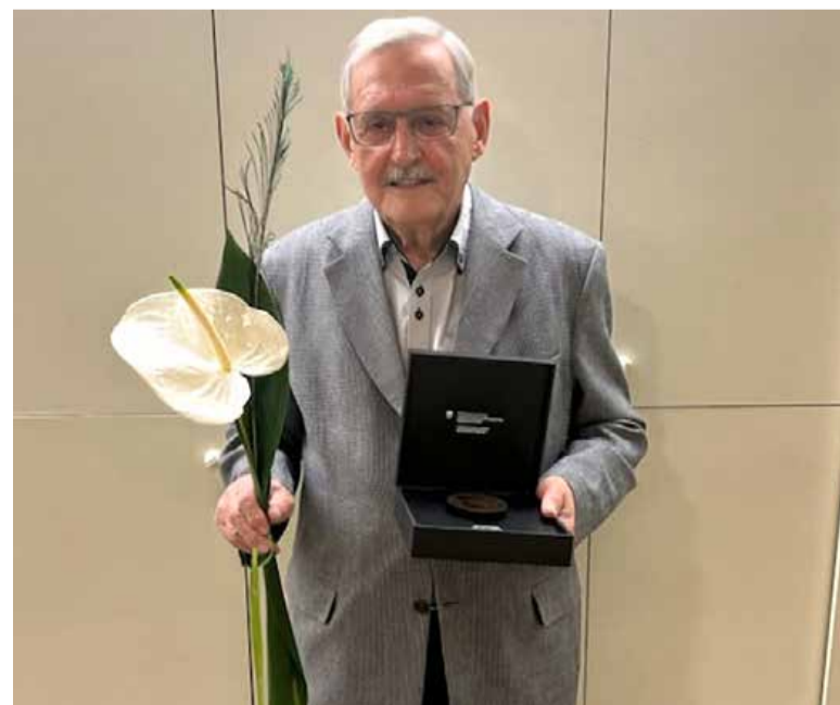
Kar 24 let je kot strokovni delavec skrbel za postavitve šolske mreže in uvedbo devetletke.

Pomagal je pri gradnji športnih objektov, kot so površine za košarko in atletiko, ter pri izboljšanju pogojev za športno vzgojo. Poleg tega je prostovoljno deloval v Športni zvezi Murska Sobota, organiziral športne dogodke in akcije, kot je Veter v laseh – s športom proti drogi. Zaslužen je tudi za posodobitve in vrnitev doma Partizan pod okrilje občine.