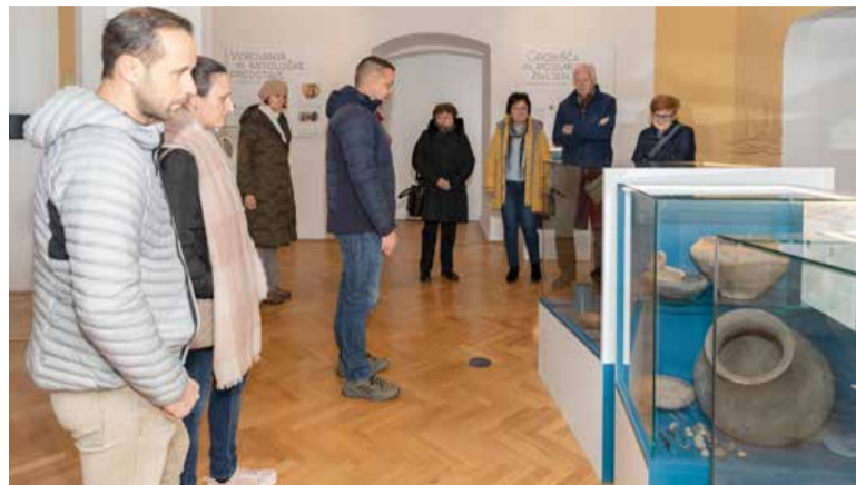
Že 70 let v murskosoboškem gradu domuje Pomurski muzej.

»Vsa umetniška dela iz stalne zbirke so inventarizirana in digitalizirana ter dostopna na Museums-