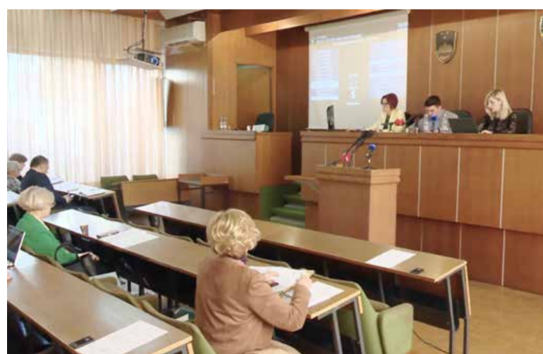
Mestni svetniki so se sestali na 17. redni seji v tem mandatu.