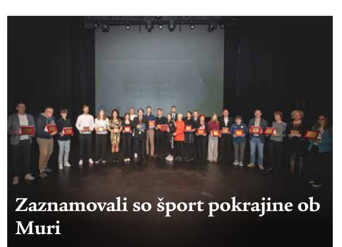
Zaznamovali so šport pokrajine ob Muri