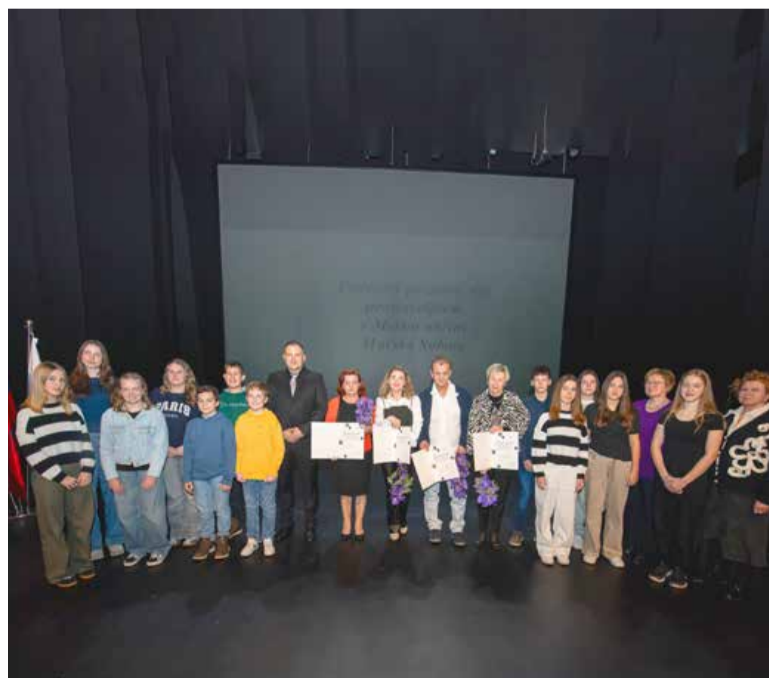
Skupinska fotografija prejemnikov županovih priznanj naj prostovoljcem in prostovoljkam v Mestni občini Murska Sobota za leto 2024.