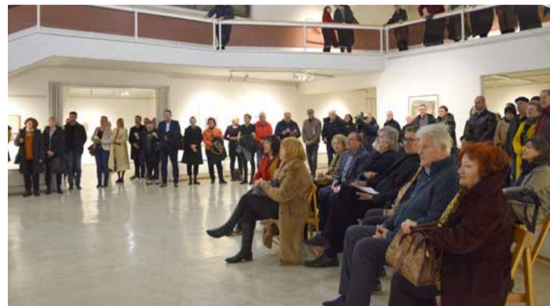
Velik obisk na odprtju razstave.

ca nastanka risbe, druga letnica umetnikove preobrazbe risbe v sliko. Begić je risbe kaširal na skrbno izbrana platna, jih z ročnimi intervencijami poenotil ter jih tako zлил z novim nosilcem. Platna na ta način dobijo funkcijo paspartuja, umetnik pa s hitrimi potezami