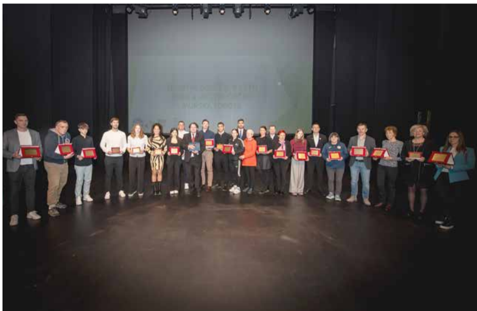
Skupinska fotografija najboljših športnic, športnikov in športnih kolektivov v mestni občini v letu 2024.