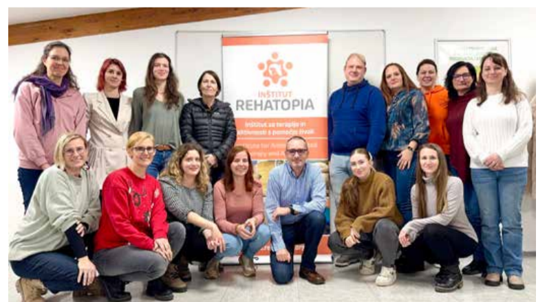
Poslanstvo Inštituta Rehatopia je ozaveščanje o terapijah in aktivnostih s pomočjo živali. Te imajo namreč izjemen vpliv na psihično, čustveno in telesno blagostanje ljudi – otrok, starejših in tudi oseb s posebnimi potrebami.

ci, veliko pozornosti namenijo samospoznavanju, spoznavanju svojih vrednot in močnih strani ter konstruktivni komunikaciji. Ob praktičnem delu v izobraževanju vključujejo veliko interaktivnih vložkov in medsebojnega sodelovanja. Posamezniki dobijo občutek in ideje, kako bi lahko svojo žival vključevali v različne naloge. Izobraževanje so ponovno izvedli januarja letos. Vse, ki so to priložnost zamudili, vabijo, da spremljajo njihov profil na Facebooku in spletno stran, kjer redno objavljajo informacije o prihodnjih izobraževanjih, dogodkih in drugih strokovnih aktivnostih. Lani so v Murski Soboti izvedli tudi prvo okroglo mizo o izobraževanju za delo s pomočjo živali. Priznani strokovnjaki so s svojih profesionalnih stališč orisali problematiko in