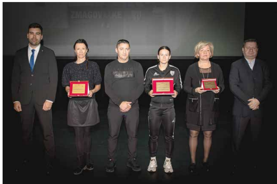
Najboljše ženske športne ekipe v Mestni občini Murska Sobota v letu 2024 med kolektivnimi športi so Ženski nogometni klub Mura Nona Murska Sobota, Društvo za ritmično gimnastiko Murska Sobota in Ženski odbojgarski klub Murska Sobota.