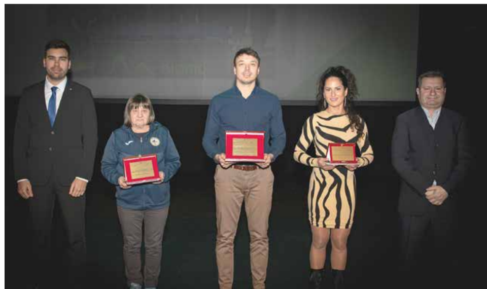
Najboljše športne ekipe v Mestni občini Murska Sobota v letu 2024 med posamičnimi športnimi panogami so Namiznoteniški klub Sobota, Atletski klub Pomurje in Plesni klub Zeko.