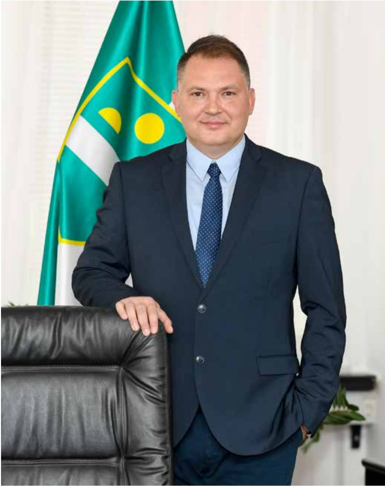
»Moje vodilo je, da morajo besede in dejanja sovpadati. Sem spoštljiv, pa četudi se z nekom kdaj ne strinjam.«