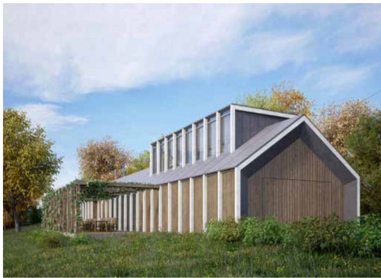
Načrt potapljaškega centra na jugozahodnem robu Soboškega jezera.

»Na organizacijskem področju smo lani največ pozornosti namenili pripravam za gradnjo potapljaškega športno-reševalnega centra na jugozahodnem robu Soboškega jezera, ki je nujno potreben. Že dvakrat nam je podvodnim reševalcem namreč zalilo prostore z opremo v zaklonišču in smo z njo zdaj praktič-