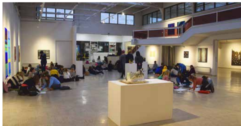
V galeriji je vselej pestro.