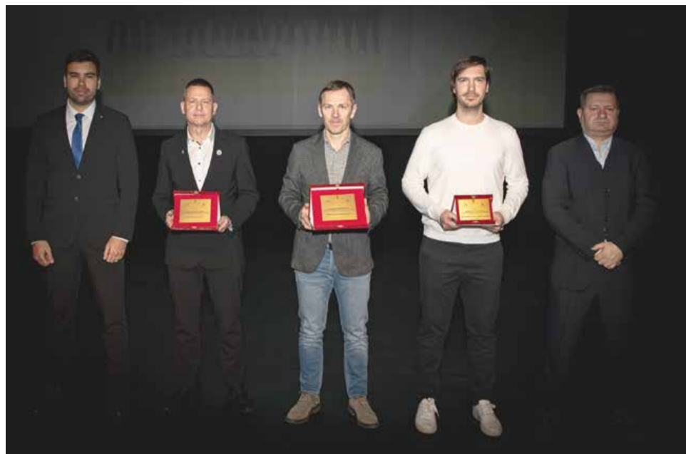
Najboljše moške športne ekipe v Mestni občini Murska Sobota v letu 2024 med kolektivnimi športi so Športni klub Pomurje deset, Društvo Nogometna šola Mura in Košarkarski klub Murska Sobota.