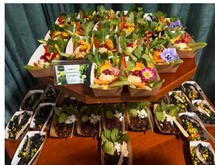
Upajo, da so navdihnili gostince in da bo sezonska, lokalna zelenjava še pogosteje našla mesto na gostinskih jedilnikih.

Zelena točka je v prostorih Pomurske gospodarske zbornice gostila dogodek Okusi sezonske zelenjave: priložnost za gostinsko dejavnost, ki je združil pomurske gostince, poslovne partnerje in novinarje.