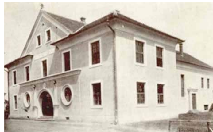
S knjigo »Dom Partizan« bo zaokrožena zgodovina soboškega športa.