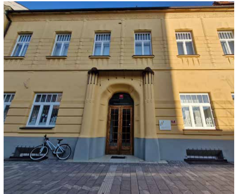
Centri za socialno delo imajo veliko odgovornosti in izzivov pri vzpostavljanju sistema dolgotrajne oskrbe.

Če nov sistem ne bo pravilno implementiran, lahko povzroči izgubo nekaterih obstoječih pravic uporabnikov ali omeji dostop do storitev, ki jih že imamo. Ker se pravica do dolgotraj-