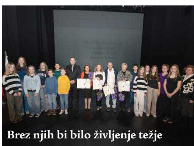
Brez njih bi bilo življenje težje