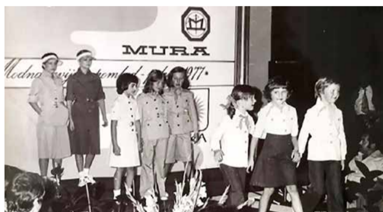
Prva dama ZDA je naredila prve korake v modno industrijo prav v Murinih oblačilih.

Ob stečaju Mure je bil star deset let. Spomni se novic o stečaju in nezadovoljnih delavcih, zgodbo o propadu pa so si zapomnili tudi njegovi vrstniki. Z objavami na družabnih omrežjih želi spremeniti to dojemanje tovarne Mura, saj je pomenila veliko več – kakovost, tradicijo in izjemno oblikovanje. Čeprav Murinih oblačil ni nosil, ceni njihovo brezčasnost in dovršenost. Pogosto obleče lep trenčkot iz 80. let. Zdaj zaključuje magistrski študij podjetništva na Ekonomski fakulteti v Ljubljani in dela na