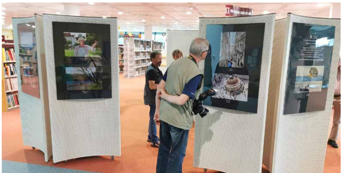
Dela radi pokažejo javnosti.

nokromatska tehnika«, na njej pa je osemnajst avtorjev sodelovalo s 34 fotografijami. Temi druge klubske razstave sta bili poletni tematiki »Na dopustu« in »Senca«. Na razstavi s prvo tematiko je sodelovalo trinajst avtorjev z 28 fotografijami, na drugi pa štirinajst avtorjev s 30 fotografijami. Zadnja razstava članov Fotokluba Murska Sobota je bila decembra lani, ko so predstavili pregled leta 2024, s tematskega vidika je bila popolnoma odprta, zanjo pa je 40 fotografij prispevalo štirinajst članov. Vse razstave so potekale v avli Pokrajinske in študijske knjižnice Murska Sobota.