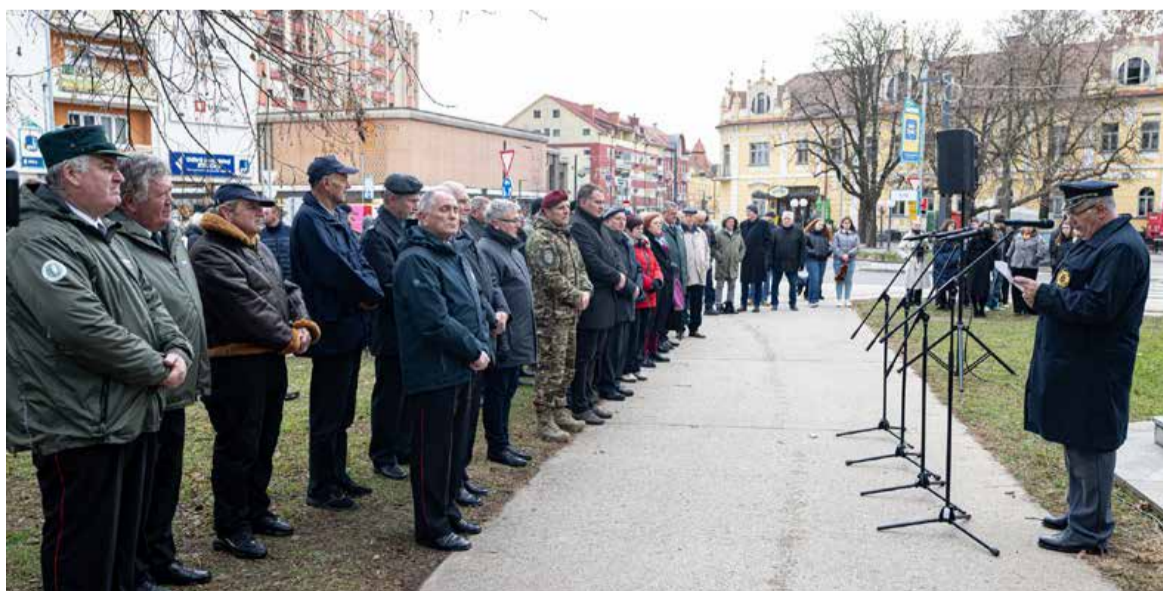
Tradicionalno mesto in tradicionalni dogodek kot poklon samostojni Sloveniji.