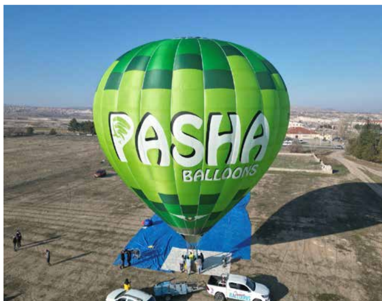
V podjetju iščejo nove možnosti za uspeh tudi v Sloveniji in Evropi.

V podjetju načrtujejo, da bodo v polnem zagonu zaposlovali nekaj deset sodelavcev, zaposlovanje pa poteka ves čas.