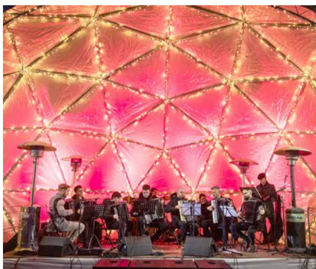
V prazničnem decembru so v prelepi kulisi nastopili številni glasbeniki, med drugim tudi Soboški harmonikarski orkester (na fotografiji).