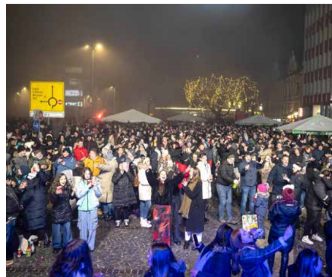
Za otroškimi silvestrovanjem je zvečer sledilo še silvestrovanje za odrasle z ansamblom Aktual in DJ Harijem.