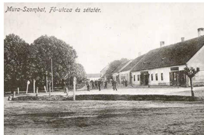
Na preslikavi stare razglednice vidimo Glavno ulico v prvem desetletju prejšnjega stoletja; fotografirano iz smeri današnje Zvezde proti Lendavski ulici.

Slovenska ulica je bila v preteklosti povezovalka cerkve sv. Nikolaja z grajskim poslopjem grofa Szaparyja.