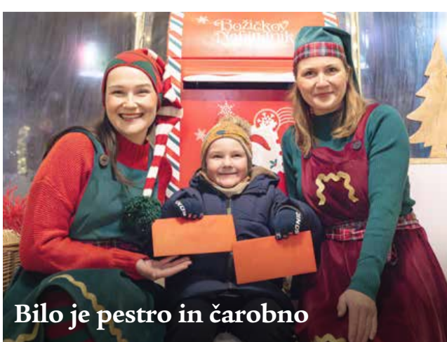
Bilo je pestro in čarobno