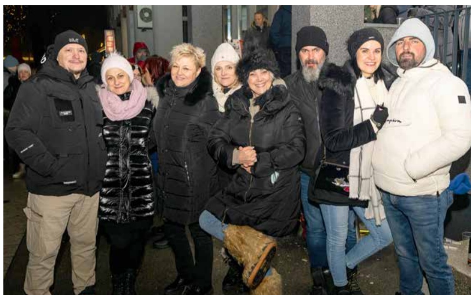
Številni obiskovalci od blizu in daleč so pred polnočjo napolnili prireditveni prostor.