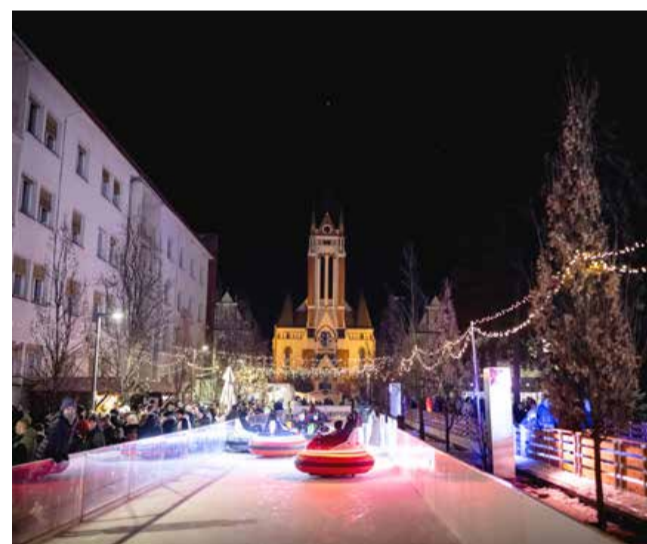
Drsanje je dopolnila gostinska ponudba v štirih lesenih hiškah, ki so priljubljeno zbirališče ob drsališču. Božični sejem ob robu Trga zmage je ponudil izdelke domače obrti, rokodelstva in prazničnih dobrot.