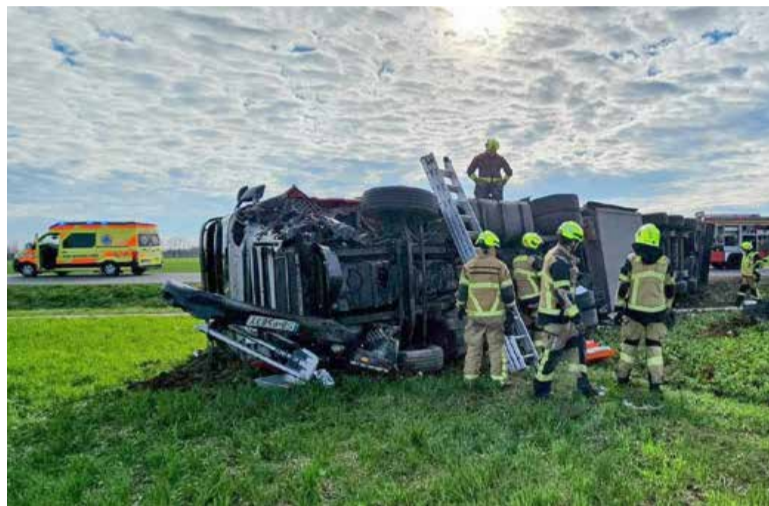
Po vrstah nesreč so lani prevladovala prometne nesreče.

Iz podatkov, ki smo jih pridobili od Gasilske zveze Mestne občine Murska Sobota, so bili tudi lani daleč najbolj »zaposleni« v PGD Murska Sobota, saj so od skupaj 218 intervencij sodelovali pri kar 193, torej pri kar 88,5 % vseh. Od preostalih enajstih gasilskih društev v mestni občini so bili gasilci PGD Pušča lani aktivirani devetkrat, gasilci PGD Bakovci, PGD Krog in PGD Nemčavci trikrat, dvakrat gasilci PGD Markišavci, PGD Rakičan in PGD Satahovič ter enkrat gasilci PGD Černelavci. Po vrstah nesreč so tudi lani prevladovala intervencije zaradi nujenja tehnične in druge pomoči (66) ter nesreč v cestnem prometu (34). Zaradi požarov različnih vrst je bilo 39 izvozov gasilcev: 16 zaradi požarov v naravi oziroma na prostem, 11 zaradi požarov na objektih, 6 zaradi požarov na prometnih sredstvih, 2 zaradi požarov v komu-