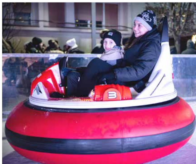
Od 28. decembra ste se lahko zapeljali s tako imenovanimi bumper car vozili in doživeli vznemirjenje ob spopadu s prijatelji, polnem smeha.