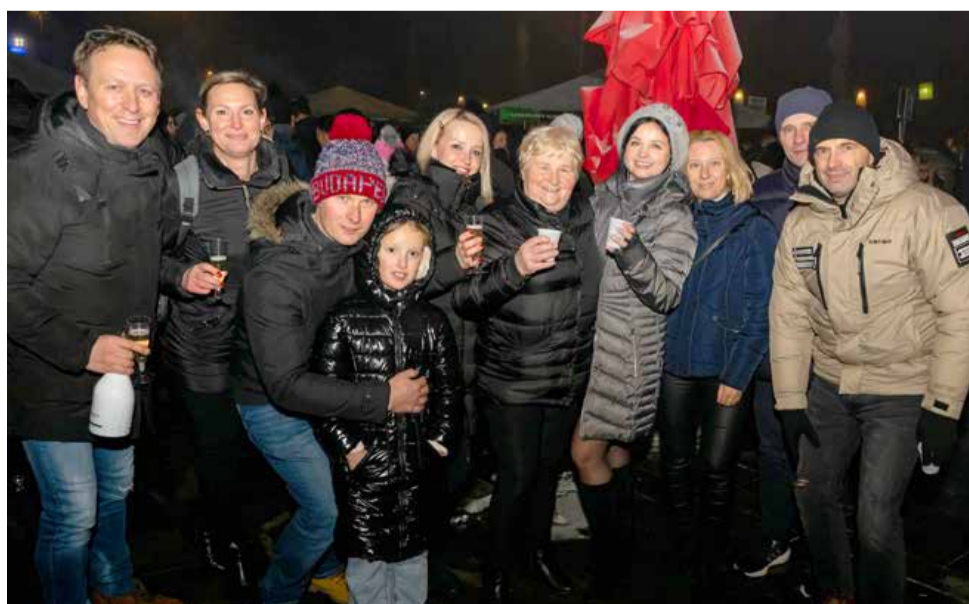
Kljub mrazu je med obiskovalci vladala dobra volja. Naj slednja ostane tudi v letu 2025.