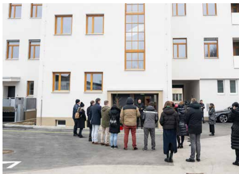
V zgradbi je na voljo dvanajst novih stanovanj.

Občina nosi tudi naziv občine, prijazne invalidom, zato je bilo ob obnovi eno stanovanje urejeno in prilagojeno za samostojno življenje invalida na vozičku. Župan se je zahvalil vsem, ki so sodelovali pri projektu, novim najemnikom pa zaželel prijetno počutje v novih domovih. Direktorica sklada se je ob tem zahvalila izvajalcem in meščanom za strpnost med prenovo, saj je bila gradnja v strogem središču mesta zahtevna ter je ovirala sosednje stanovalce, pešce in javni promet. Izvajalec prenove je bilo domače gradbeno podjetje Pomgrad, s katerim je bila pogodba podpisana oktobra 2023. Vsa dela so potekala po predvidenem terminskem načrtu. Vrednost investicije je znašala 2.483.817,74 evra.