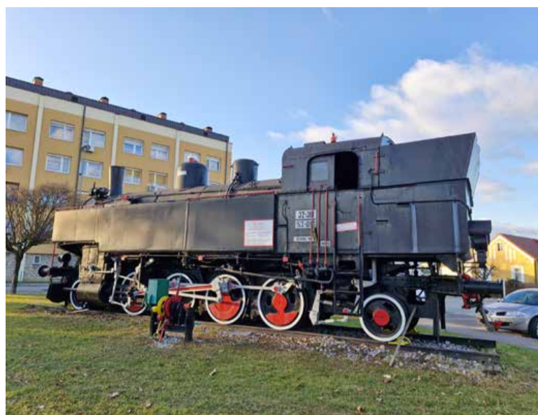
Lokomotiva JŽ 53-017 pred železniško postajo v Murski Soboti, ki jo poznamo pod vzdevkom Gorička Mariška, čeprav to ni tista prava Gorička Mariška, ki je ob ukinitvi proge med Puconci in Hodošem leta 1968 opravila zadnjo vožnjo na tej progi. Lokomotiva je iz leta 1928 in je vozila po prleških in prekmurskih progah.