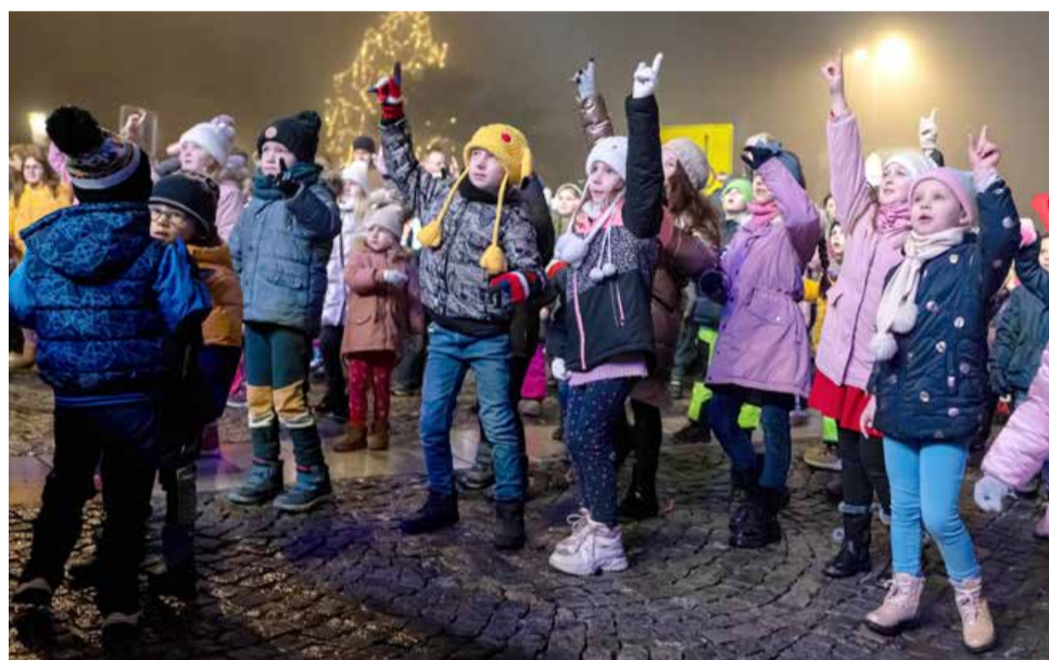
Otroci so se zabavali na silvestrovanju za najmlajše, ki se je začelo – kot vsako leto doslej – ob 17. uri.