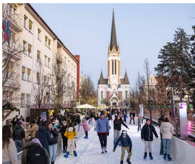
Drsališče je priljubljeno zbirališče mladih in starih, ob njem je bilo še posebno živahno decembra. Obratovalo bo do 26. januarja 2025.