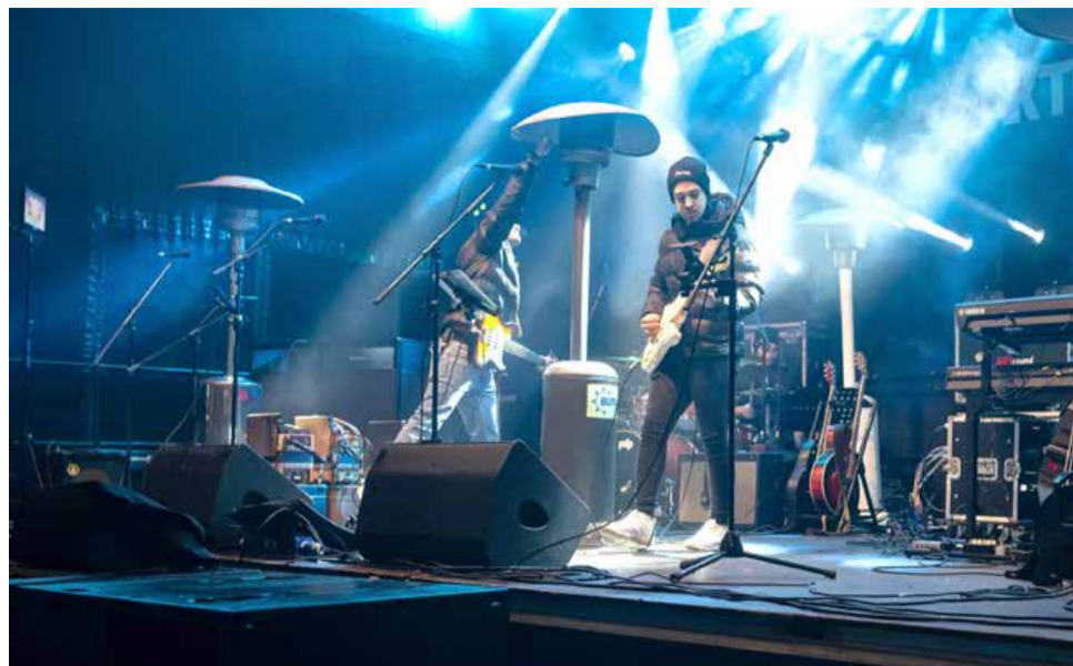
Člani glasbene skupine Aktual so poskrbeli za zabavo, kar je bilo v hladni noči več kot dobrodošlo.