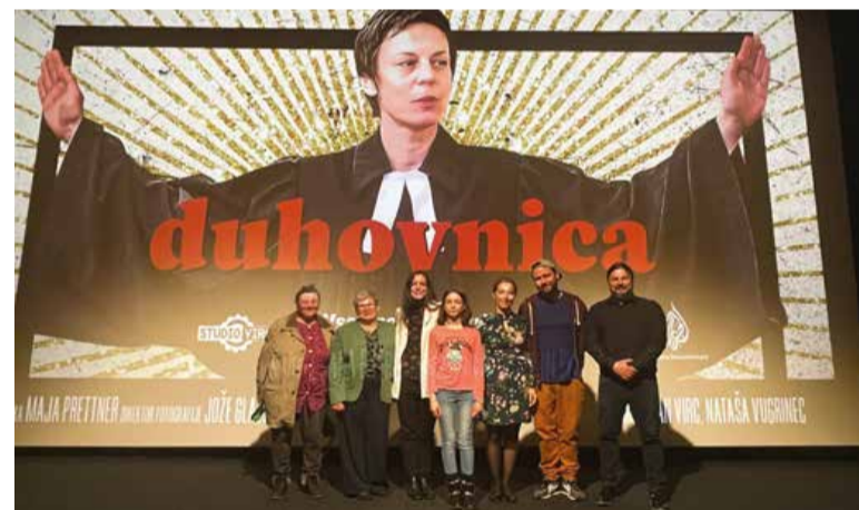
»Duhovnica« – dokumentarni film, ki je v letu 2024 večkrat razprodal dvorano Gledališča Park.

konec tedna (16. in 17. januarja), na ponedeljkovo potopisno predavanje Iztoka Bončine o Libanonu ter na abonmajski predstavi »Arzenik