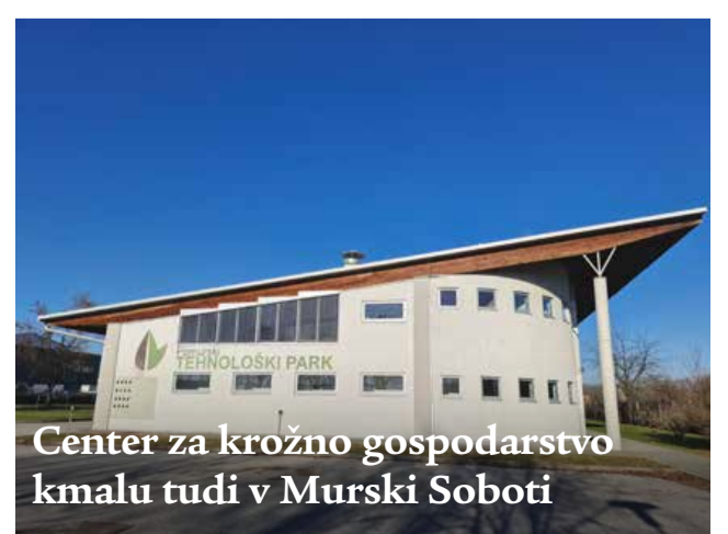
Center za krožno gospodarstvo kmalu tudi v Murški Soboti