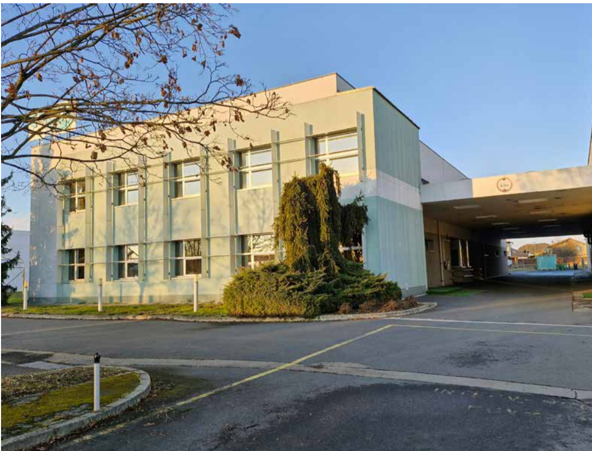
Prva slovenska tovarna toplozračnih balonov Pasha Balloons deluje v Tišinski ulici, v objektu nekdanjega Galexa.

Turško podjetje Pasha Balloons je v Murski Soboti začelo z dejavnostjo, ki odpira nova delovna mesta in mednarodne priložnosti.