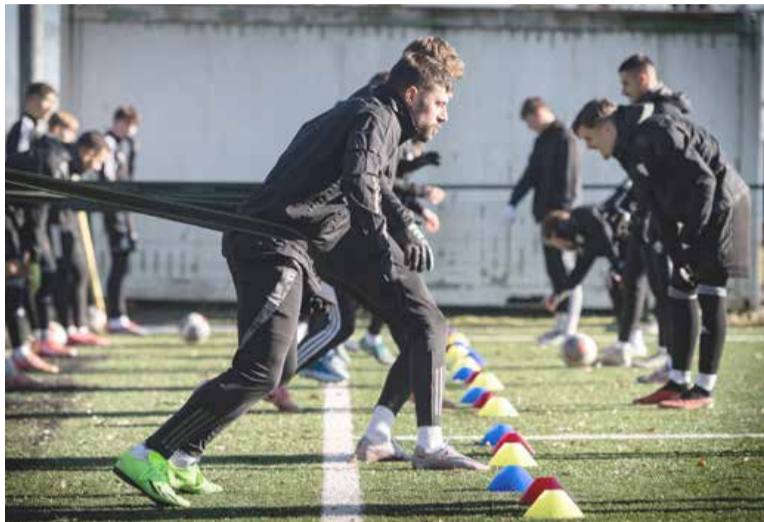
Muraši so tokrat pohiteli z začetkom priprav na nadaljevanje prvenstva. Spomladi si ne želijo zgolj več zmag, temveč zlasti umiritev razmer v klubu in okoli njega.