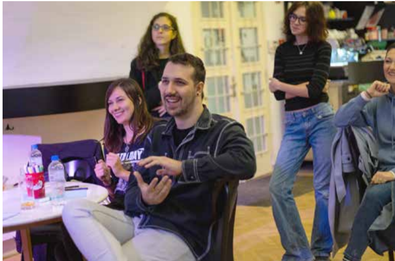
Mladi so jedro programskih usmeritev vodstva.

jekte. V okviru programa Erasmus+: Mladi v akciji so v minulem letu izvedli mladinsko izmenjavo Kjer preteklost sreča prihodnost, v kateri je 34 mladih iz Slovenije, Hrvaške, Litve,