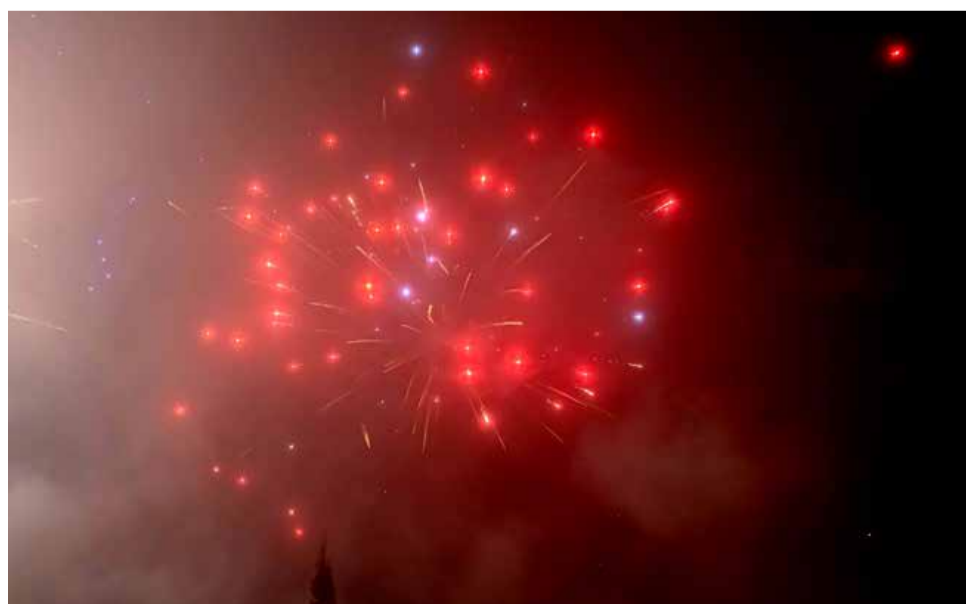
Ognjemet je za nekaj trenutkov osvetlil nebo nad Mursko Soboto.