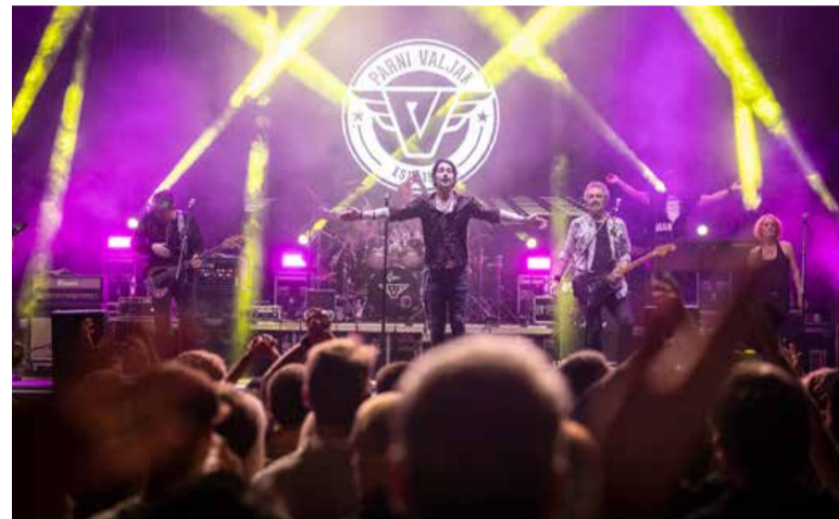
Soboški dnevi 2024 – pri Zavodu za kulturo, turizem in šport Murska Sobota ocenjujejo, da je dogodka festivala obiskalo okrog 35.000 obiskovalcev od blizu in daleč.

Ob tem vabijo na projekciji večkrat nagrajenega filma »Anora« ta