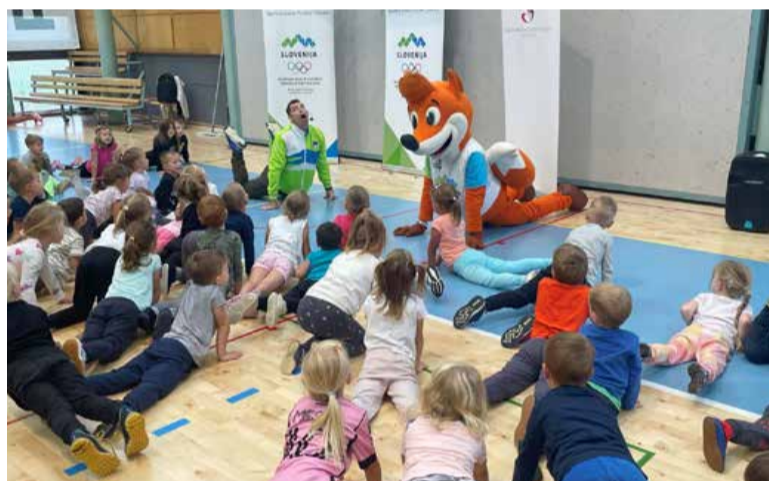
Mini olimpijada – športni dogodek za najmlajše tradicionalno organizirajo v sodelovanju z Olimpijskim komitejem Slovenije.