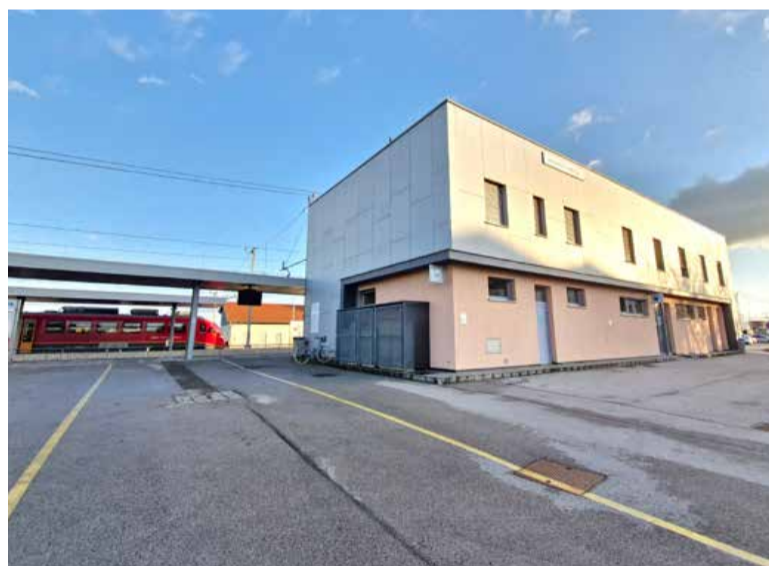
Železniška postaja v Murski Soboti.

1200 delavcev, med njimi je bilo 250 ruskih beguncev, petdeset delavcev iz Bosne in sto bolgarskih delavcev, preostali so bili domačini iz Pomurja in bližnjega hrvaškega Medžimurja. Ruski begunci so si ob nasipu v Mekotnjaku uredili barakarsko naselje in imeli celo lasten izvir pitne vode, imenovan Ruski studenec.