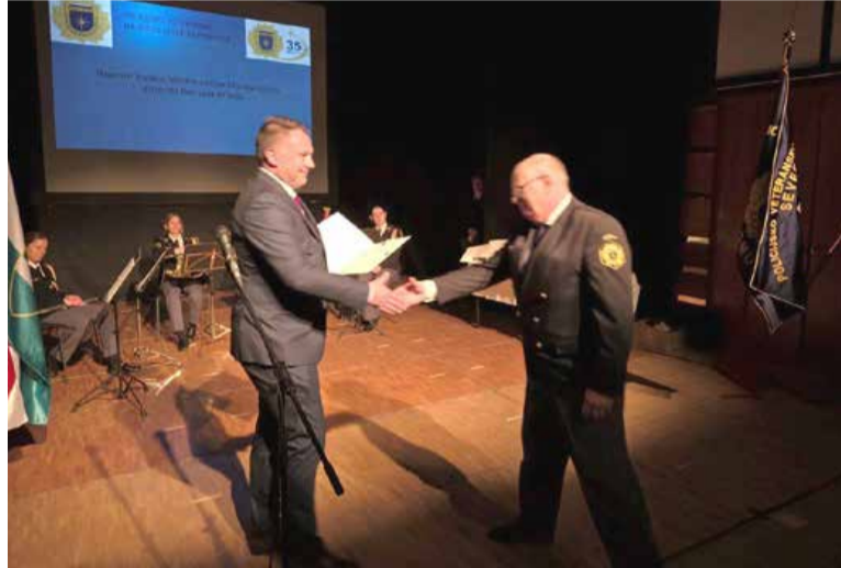
Glavno poslanstvo društva je ohranjati spomin na dogodke pred vojno za osamosvojitve Slovenije in med njo ter krepiti domoljubje.