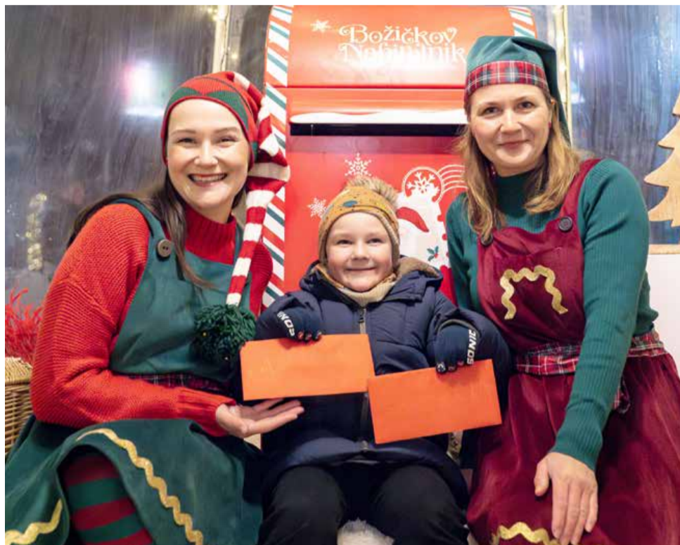
V Božičkovem nabiralniku, ki je Slovenijo povezal v prazničnem duhu, so lahko otroci na Trgu zmage oddali pismo Božičku.

Obiskovalce je tekom prejšnjega meseca razveseljeval bogat spremljevalni program. Drevored Martina Luthra z drsališčem tako ni le prostor za rekreacijo temveč tudi srce mestnega družabnega življenja v tem prazničnem času. Drsališče bo sicer obratovalo še do 26. januarja.