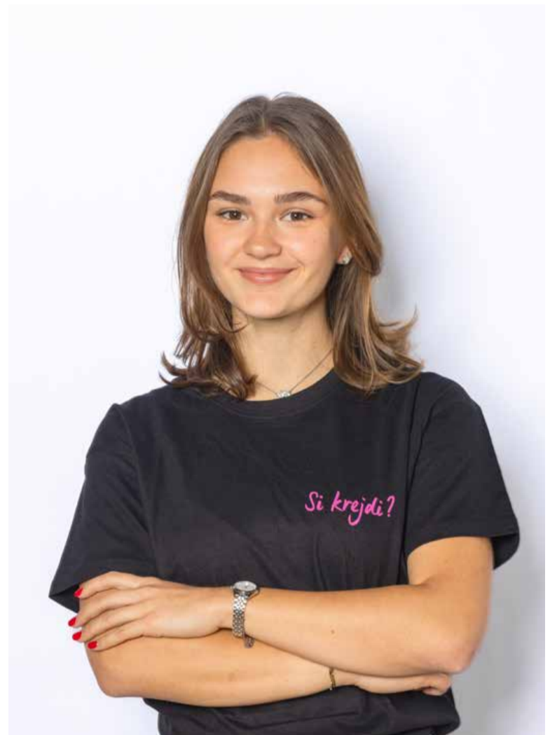
V klubu si bodo še naprej prizadevali, da delovanje dvignejo na še višjo raven.

Študentsko življenje v Murski Soboti se, kot pravi nova predsednica, močno razlikuje od tistega v Ljubljani. Glavni razlog je odsotnost univerze ali rednih študijskih smeri v mestu. A marsikatera slabost je lahko tudi prednost – na obeh straneh. Tako se mladi iz Prekmurja, ki se po srednji šoli odpravijo na študij v univerzitetna mesta, hitreje osamosvojijo, negativna plat pa je, da zapustijo domače