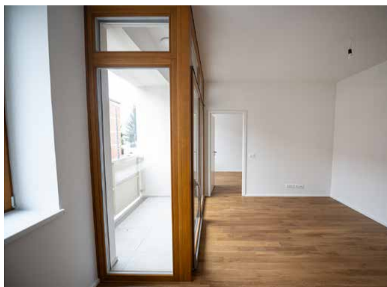
Vsa stanovanja v prenovljeni zgradbi so dodeljena po javnem razpisu in bodo vseljiva ta mesec.