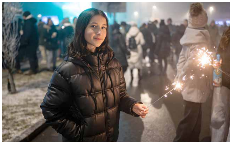
Lepo je bilo videti, da znajo mladi uživati tudi v majhnih rečeh.