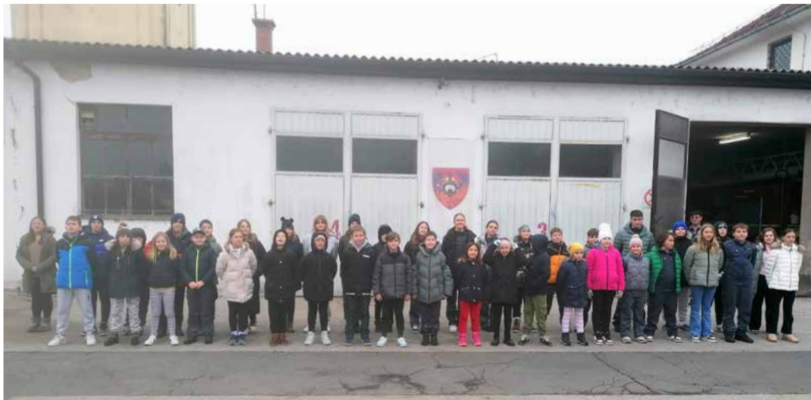
Za pridobitev novih znanj je med mladimi veliko zanimanja.