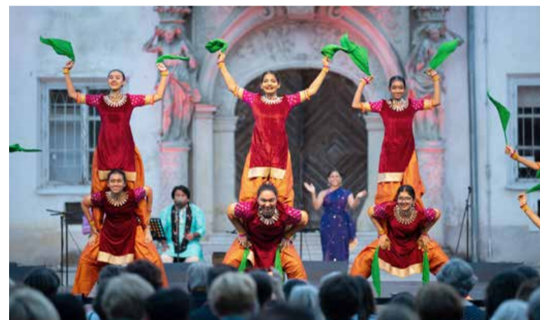
Folkart – Soboški dnevi vsakič v mesto privabijo folkloriste z drugih koncev sveta.