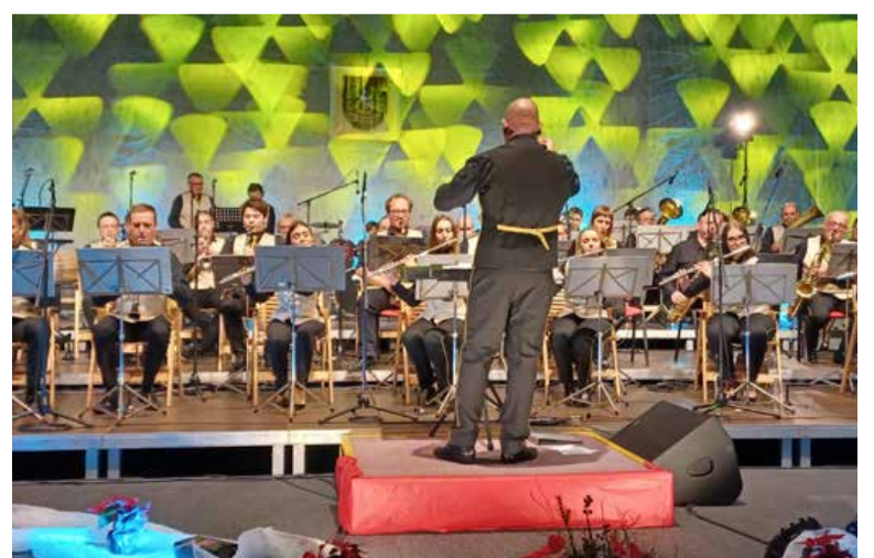
Še en vrhunski glasbeni dogodek.

za stike z javnostjo, je povedal, da je zasedba Pihalnega orkestra Murska Sobota na tem koncertu štela štirideset članov, ki so blizu šesto obiskovalcem pričarali vrhunsko glasbeno izkušnjo, saj tovrstni glasbeni nastopi domačih pihalnih orkestroniso ravno pogosti. Dolgoletno tradicijo, ki je pomemben prispevek k čarobnosti praznikov ob koncu leta, bodo negovali tudi v prihodnje, spored nastopov v letošnjem letu pa je tudi že skorajda sestavljen.