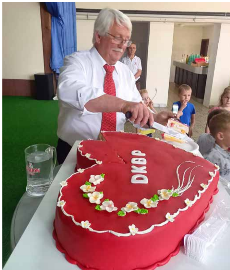
Predsednik in veliko srce.

Glavne aktivnosti društva so različne strokovne vadbe za člane, ki potekajo vse leto, razen v poletnih mesecih. »Izvajamo vadbo po programu Srce za zdravje 2, ki je program opolnomočenja bolnikov s srčnim popuščanjem in sodelovanja z vsebinami drugih društev,« poudarja Stropnik. V medgeneracijskem središču Mensana, kjer imajo delovne prostore, občasno pa se srečujejo tudi v telovadnici Osnovne šole II Murska Sobota, jih izvajajo strokovno usposobljeni vaditelji. Poslanstvo društva obsega tudi druženje članov in s sorodnimi društvi, izmenjavo mnenj ter strokovno usposabljanje. Skupaj z društvom za osteoporozo so bili na izletu v Beli krajini. Ker si prizadevajo dejavnost približati čim širšemu krogu ljudi oz. vključiti večino pomurskih bolnikov s koronarno boleznijo, je njihov strokovni cilj v bližnji prihodnosti ustanovitev vadbenih skupin po celotnem Pomurju. Pristrčno praznovanje in druženje ob prvi obletnici delova-