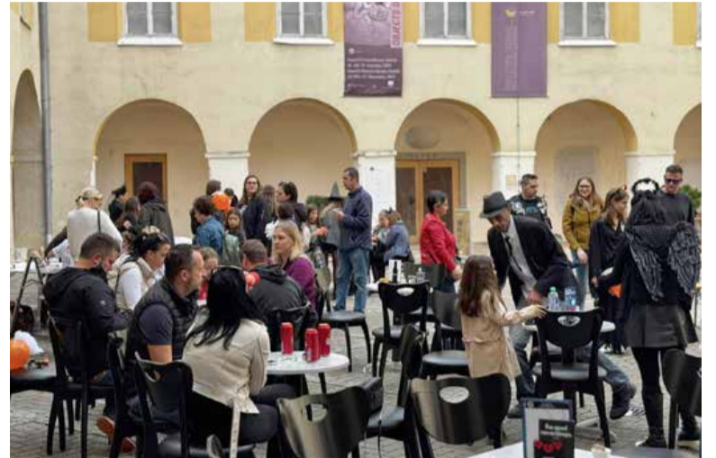
Ob okroglem jubileju želijo privabiti čim več obiskovalcev na njihove dogodke.

Izvajajo številne programe Urada Republike Slovenije za mladino, ki podpira mladinske