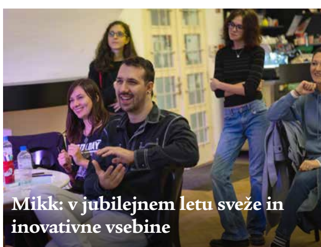
Mikk: v jubilejnem letu sveže in inovativne vsebine