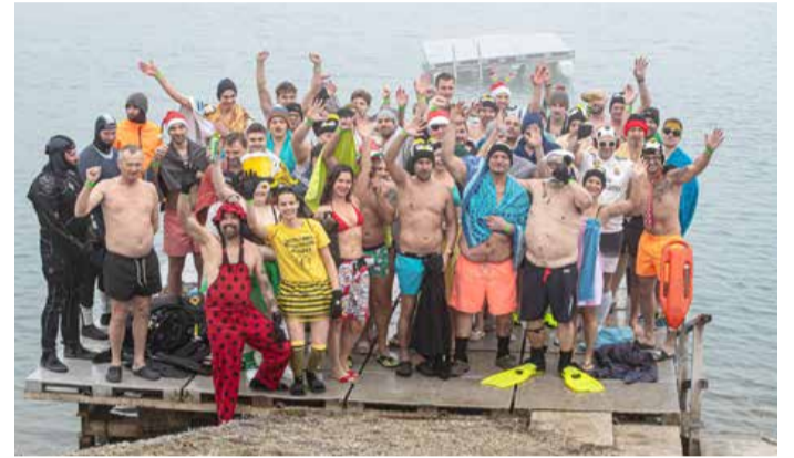
Na novoletni dan je v Kamenšnici zaplavalo 58 Dahavskih pingvinov, ki so se jim pridružili tudi drugi ljubitelji plavanja v hladni vodi.

Člani društva so 1. januarja že desetič organizirali novoletno kopanje v hladni vodi murskosoboške Kamenšnice.