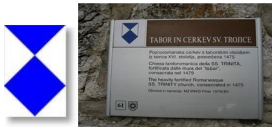
Slika 2: Označevanje nepremičnih kulturnih spomenikov

Objekte kulturne dediščine je potrebno čim prej zavarovati tudi pred vremenskimi vplivi, premično pa premestiti v ustrezne objekte, kjer se lahko izvajajo tudi najnujnejša konzervatorska dela. Register poleg opisnih podatkov za vsako enoto vsebuje tudi geolokacijske podatke. Podatki iz registra so javni. Nepremična kulturna dediščina, ki je razglašena za kulturni spomenik, se označuje z znakom Haaške konvencije.