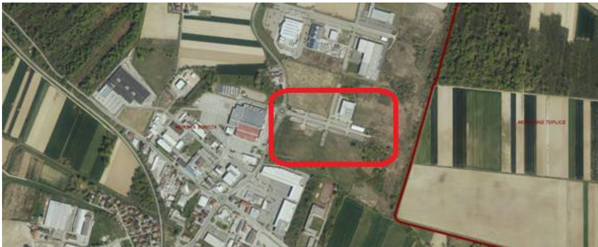
Slika 1: Severno obrtno industrijska cona (parkirišča)