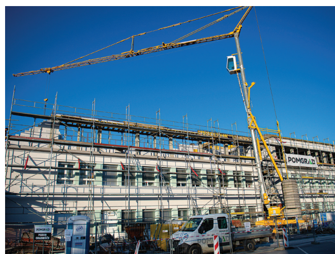
Nadzidava zdravstvenega doma