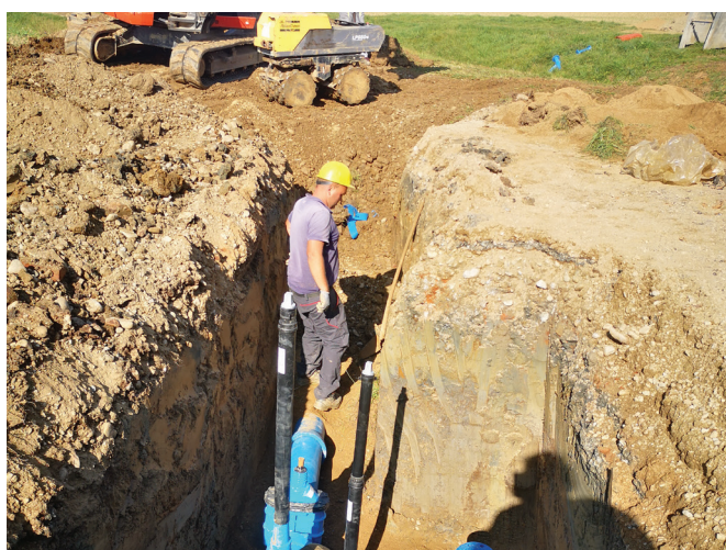
Izgradnja Vodovoda sistema B