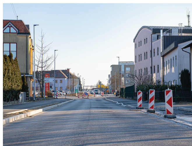
Dokončanje Gregorčičeve ulice