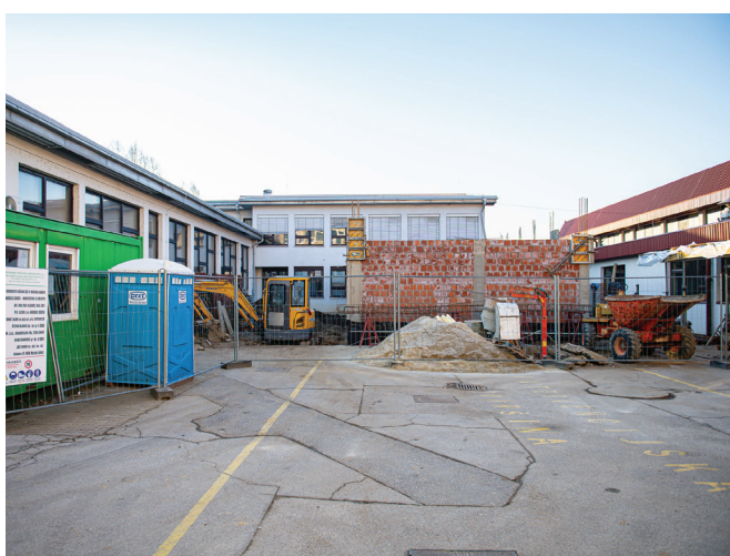
Dograditev učilnic na OŠ IV