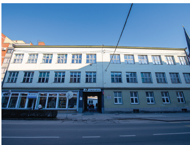
Ureditev 15 stanovanj za mlade