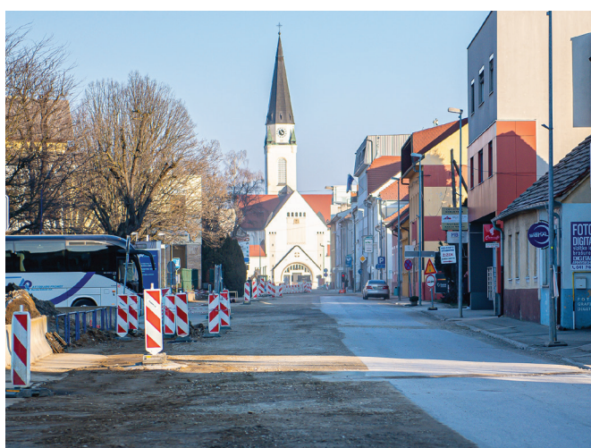
Dokončanje Slomškove ulice