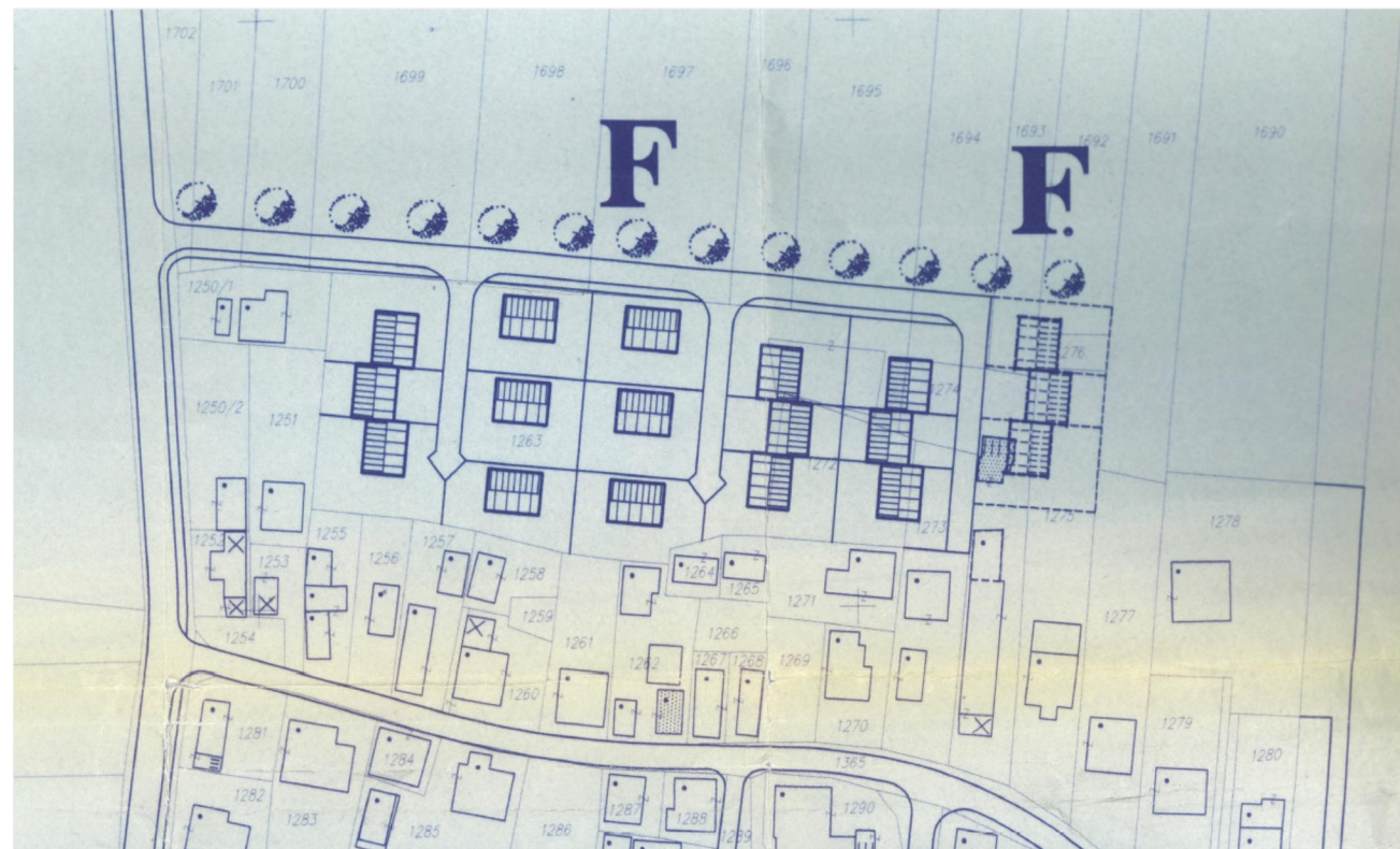
Kopija iz grafičnega dela Odloka o ureditvenem načrtu za območje dela naselja Černelavci – ulici Pušča in Kranjčeva (zaselek Pušča), (Uradni list RS, št. 79/1997), list št.: 6, ARHITEKTONSKA SITUACIJA - OBMOČJE F – predvidena stanovanjska zazidava - sever