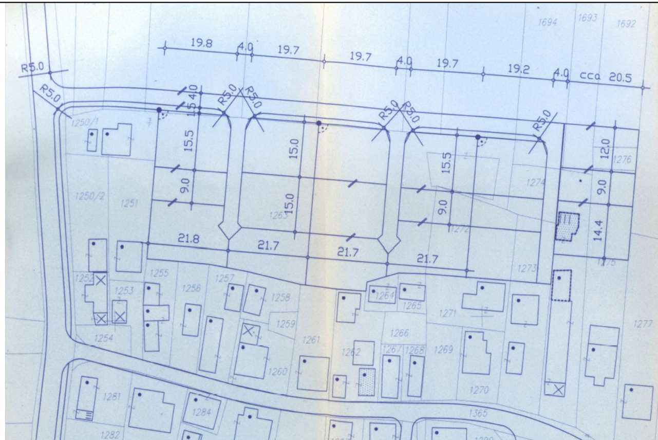
Kopija iz grafičnega dela Odloka o ureditvenem načrtu za območje dela naselja Černelavci – ulici Pušča in Kranjčeva (zaselek Pušča), (Uradni list RS, št. 79/1997), list št.: 7.1, PARCELACIJA - OBMOČJE F – predvidena stanovanjska zazidava - sever