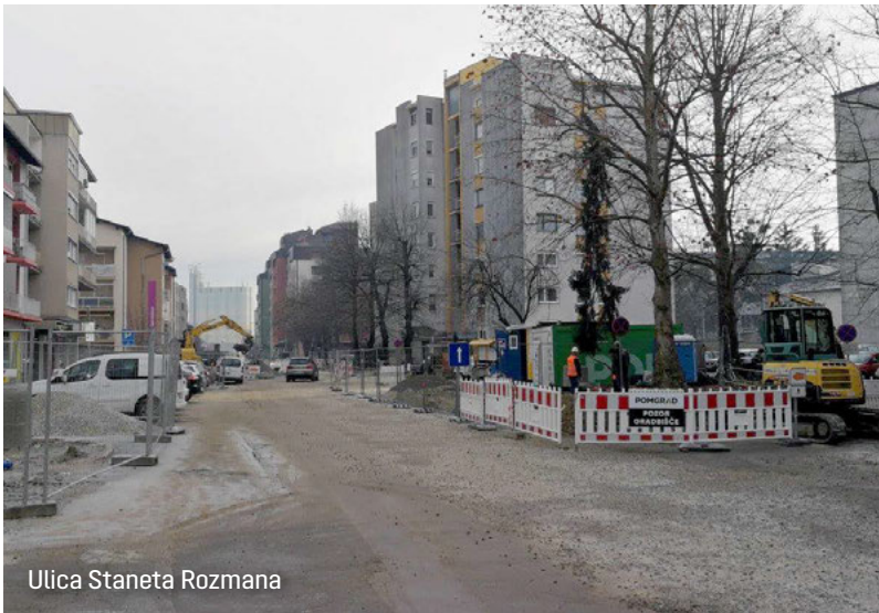
Ulica Staneta Rozmana