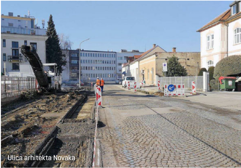
Ulica arhitekta Novaka