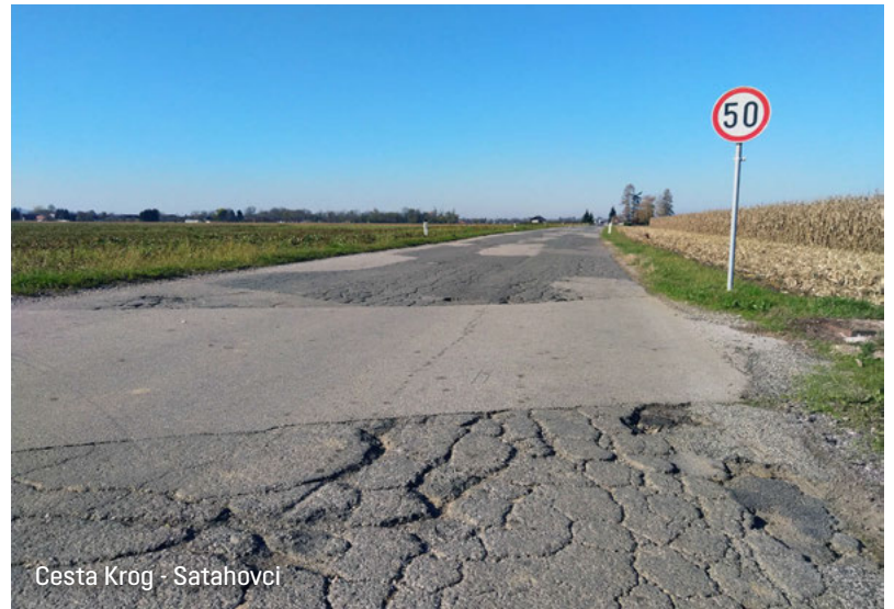
Cesta Krog - Satahovci